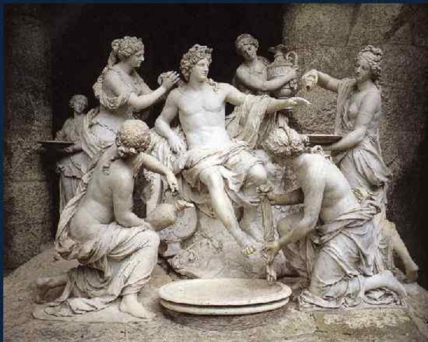
Франсуа Жирардон. Аполлон и нимфы. 1666-1673. Версаль