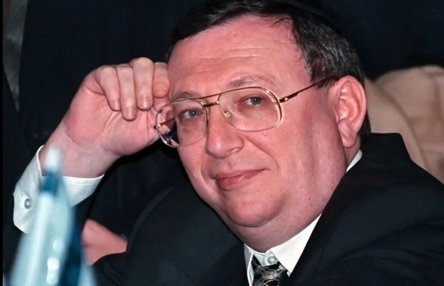
ГУСИНСКИЙ ВЛАДИМИР АЛЕКСАНДРОВИЧ