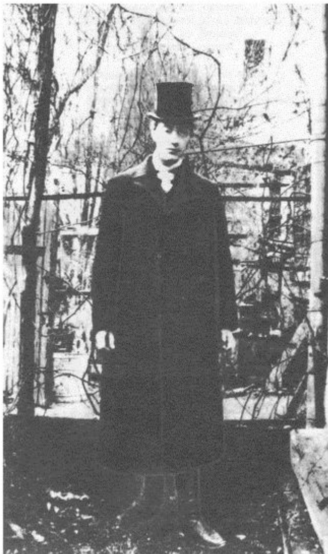
Н.С.Гумилёв (Nikolay Gumilev) Париж, 1908 год.

Творческое воображение пробудило в Гумилеве жажду познания мира. После окончания гимназии Гумилев уехал в Париж, в Сорбонну. К этому времени он был уже автором книги «Путь конквистадоров», замеченной одним из законодателей русского символизма Валерием Брюсовым.