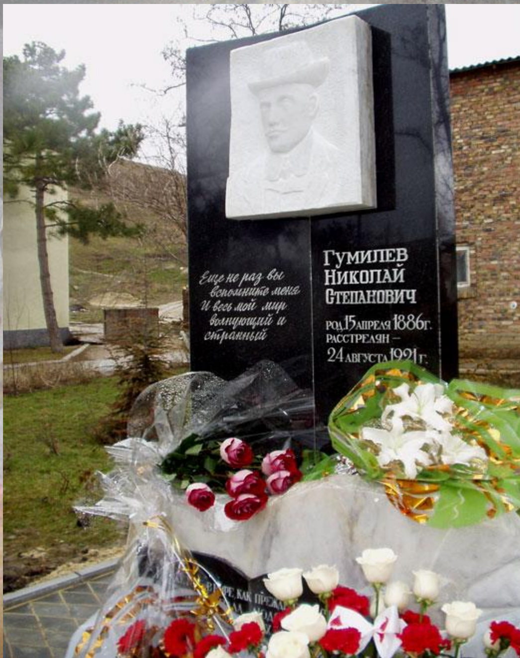
Коктебель, перед Домом культуры «Юбилейный»