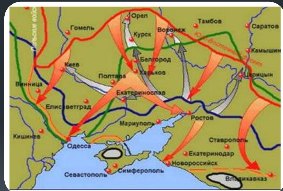
Разгром Белых Армий на юге.