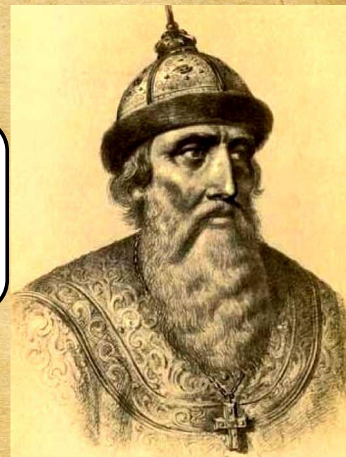
Владимир Всеволодович Мономах (1053—1125)