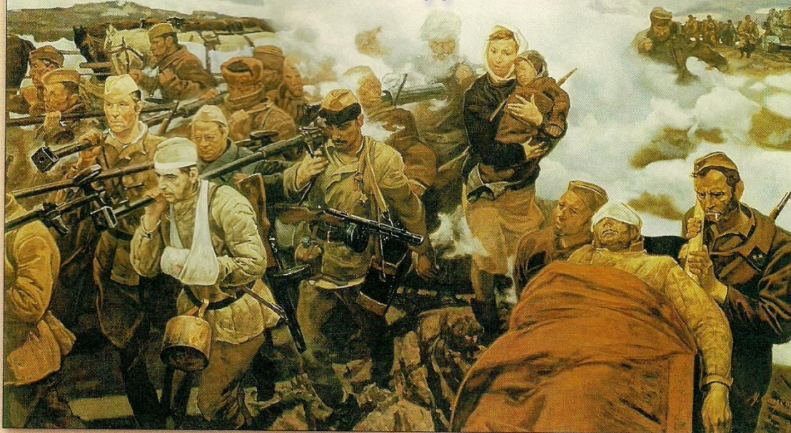
М.И.Самсонов. В боях за Отчизну. 1987