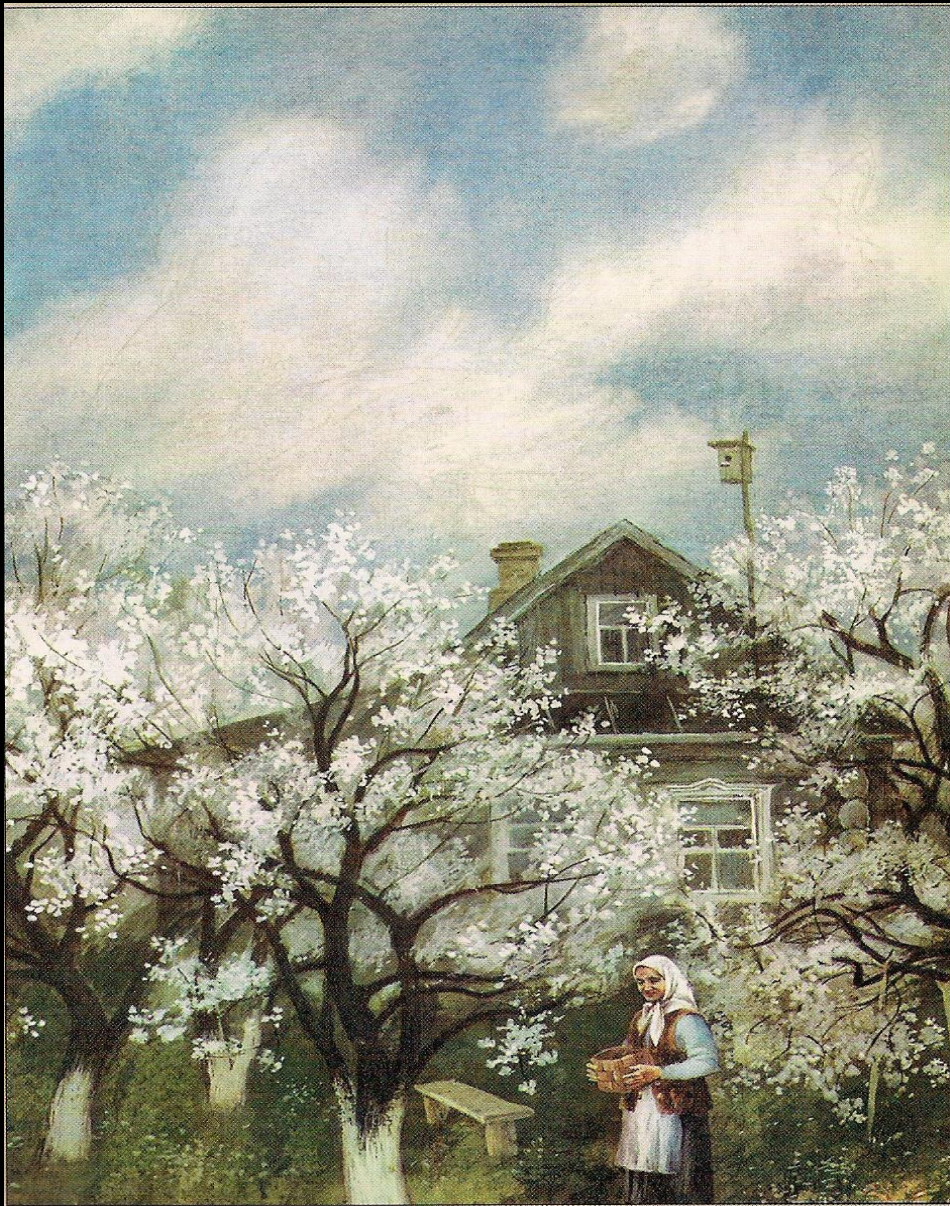
С.Бордюга. Иллюстрация к рассказу «Живое пламя»