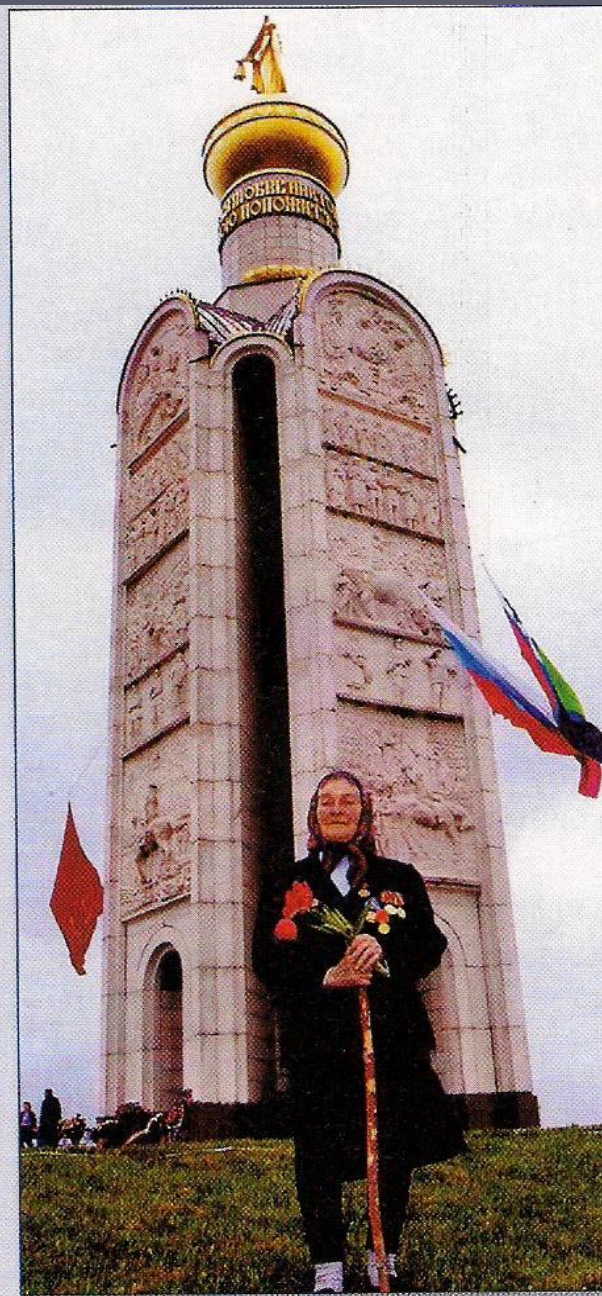
На Прохоровском поле. 2000-е гг.