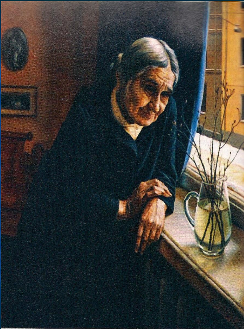
А.Шилов. Зацвел багульник. 1980