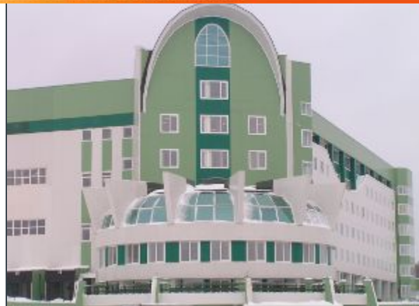
Распреде- лительные центры, складские комплексы