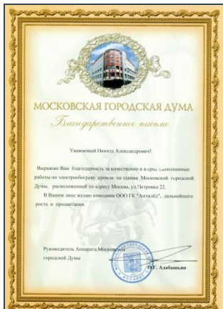
Московская Городская Дума