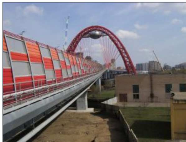
Тоннели, мосты и многое другое.....