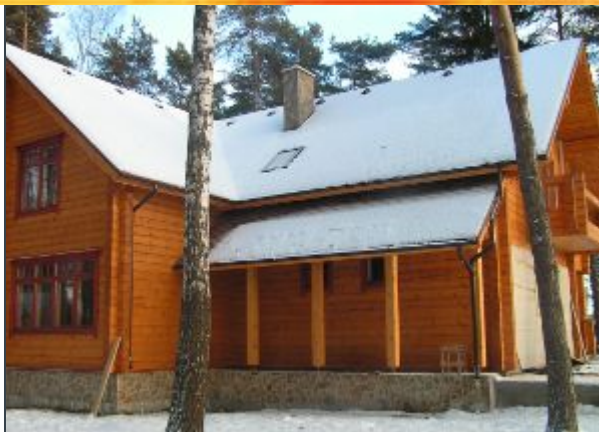
Частные дома, коттеджи