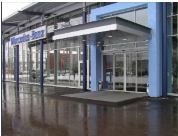
Автоцентры, офисные здания.