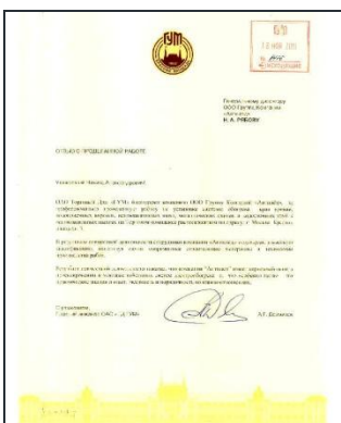
Торговый дом ГУМ