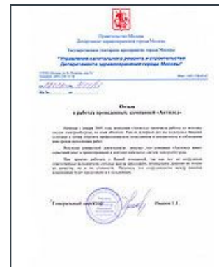
ГУП УКРиС ДЗ г. Москвы