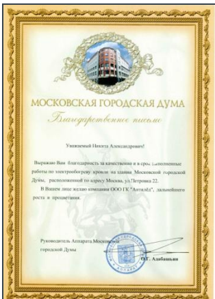
Московская Городская Дума