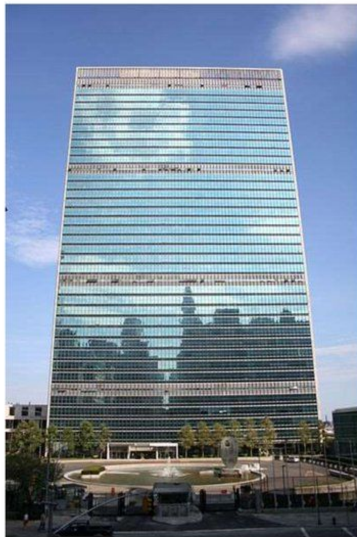
Штаб-квартира ООН в Нью-Йорке

Это уникальное международное сообщество, имеющее целью способствовать поддержанию и укреплению мира, экономическому и социальному прогрессу всех стран и народов.