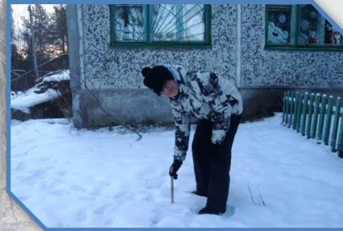
Высота снежного покрова(см).