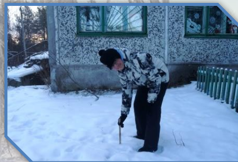
Высота снежного покрова(см).