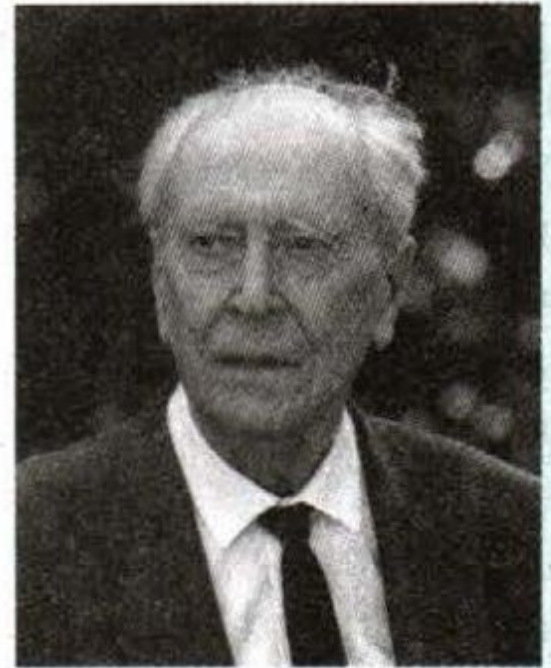
Д. С. Лихачёв

«Под культурными ценностями подразумеваются не только отдельные объекты — памятники архитектуры, скульптуры, живописи, письма, печати, археологии, прикладного искусства, музыки, фольклора, которые могут быть отмечены в списках, каталогах и т. п., но и явления, такие, как традиции и навыки в области искусства, науки, образования, поведения, обычаев, культурных индивидуальностей народов, групп населения, отдельных людей и т. д.».