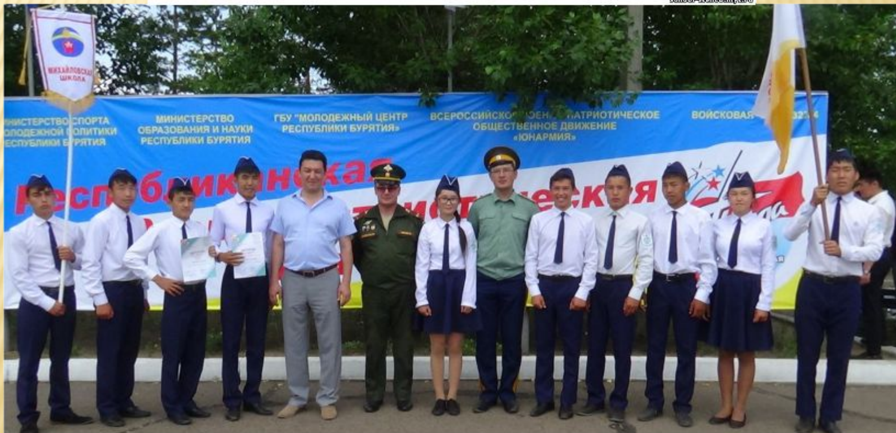
Победители Республиканской патриотической акции «Победа»