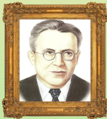
С. Я. Маршак