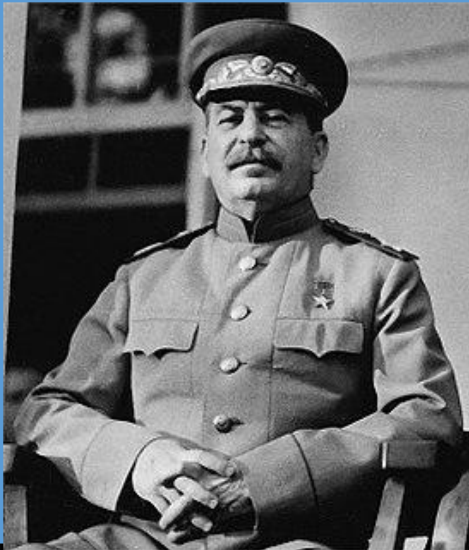
Иосиф Виссарионович Джугашвили (Сталин)