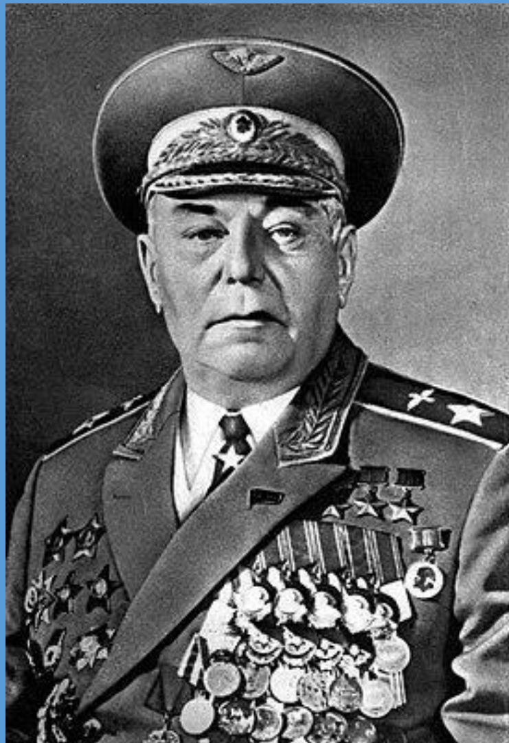
Покрышкин, Александр Иванович