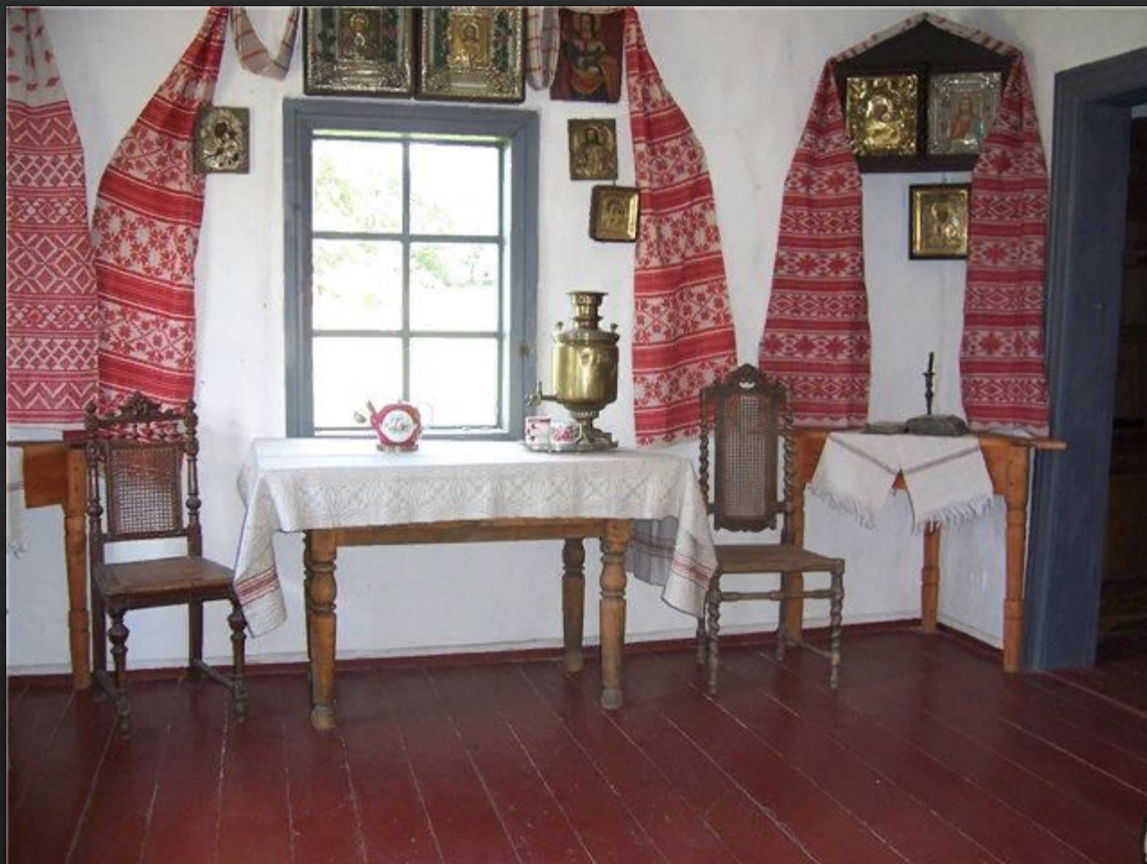
Красный угол в казачьей хате

Однако самое важное, самое главное, что отличало казака от любого другого жителя России, это его душа, его убеждения. О вере казаков в Бога, верности их своему царю и их любви к своей малой родине всегда слагались легенды. Возможно, именно это давало им силы для побед в любых сражениях.