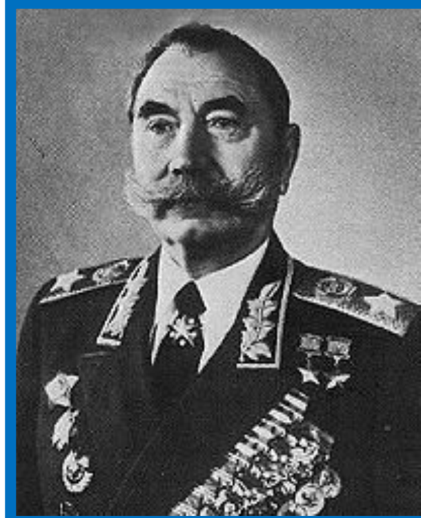
Семён Михайлович Буденный – советский военачальник, командующий Юго-Западным фронтом в начале ВОВ