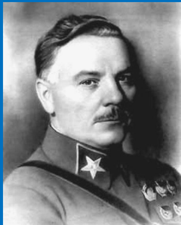
Климент Ефре́мович Вороши́лов – советский военачальник, командующий Северо-Западным фронтом в начале ВОВ