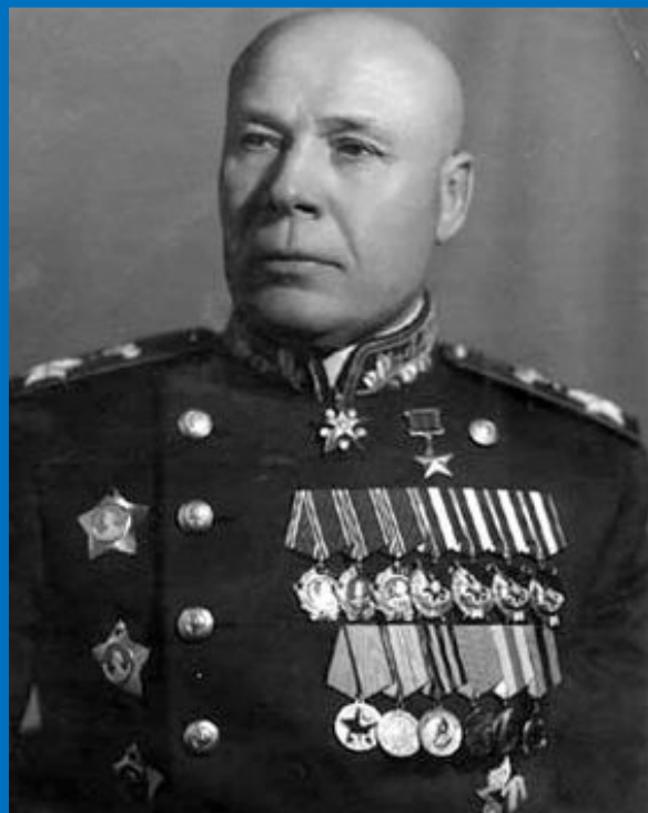
Семён Константи́нович Тимоше́нко – советский военачальник, командующий Западным фронтом в начале ВОВ