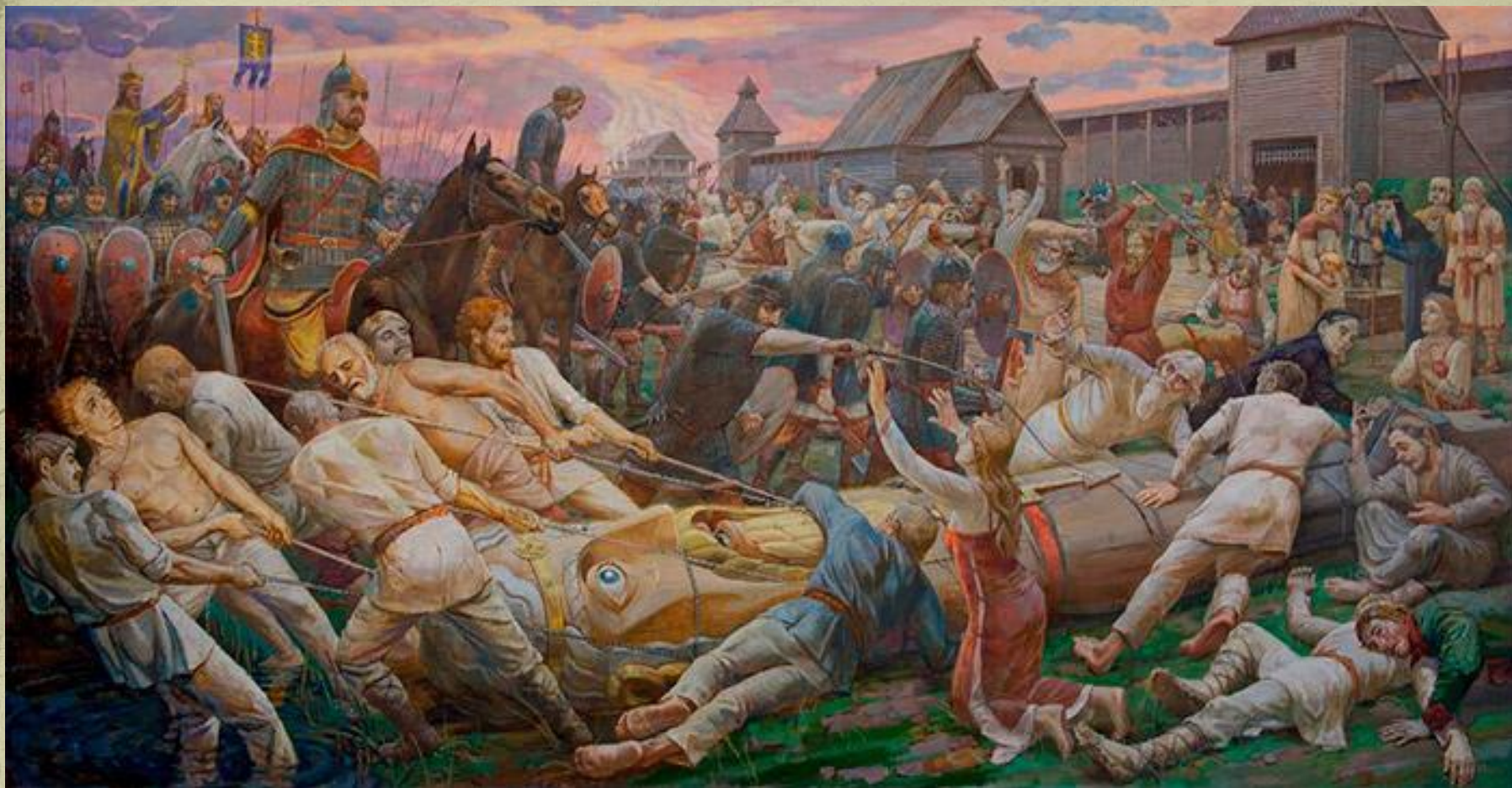
Штыров Е. С. «Попрание древнерусских богов» (в Новгороде)