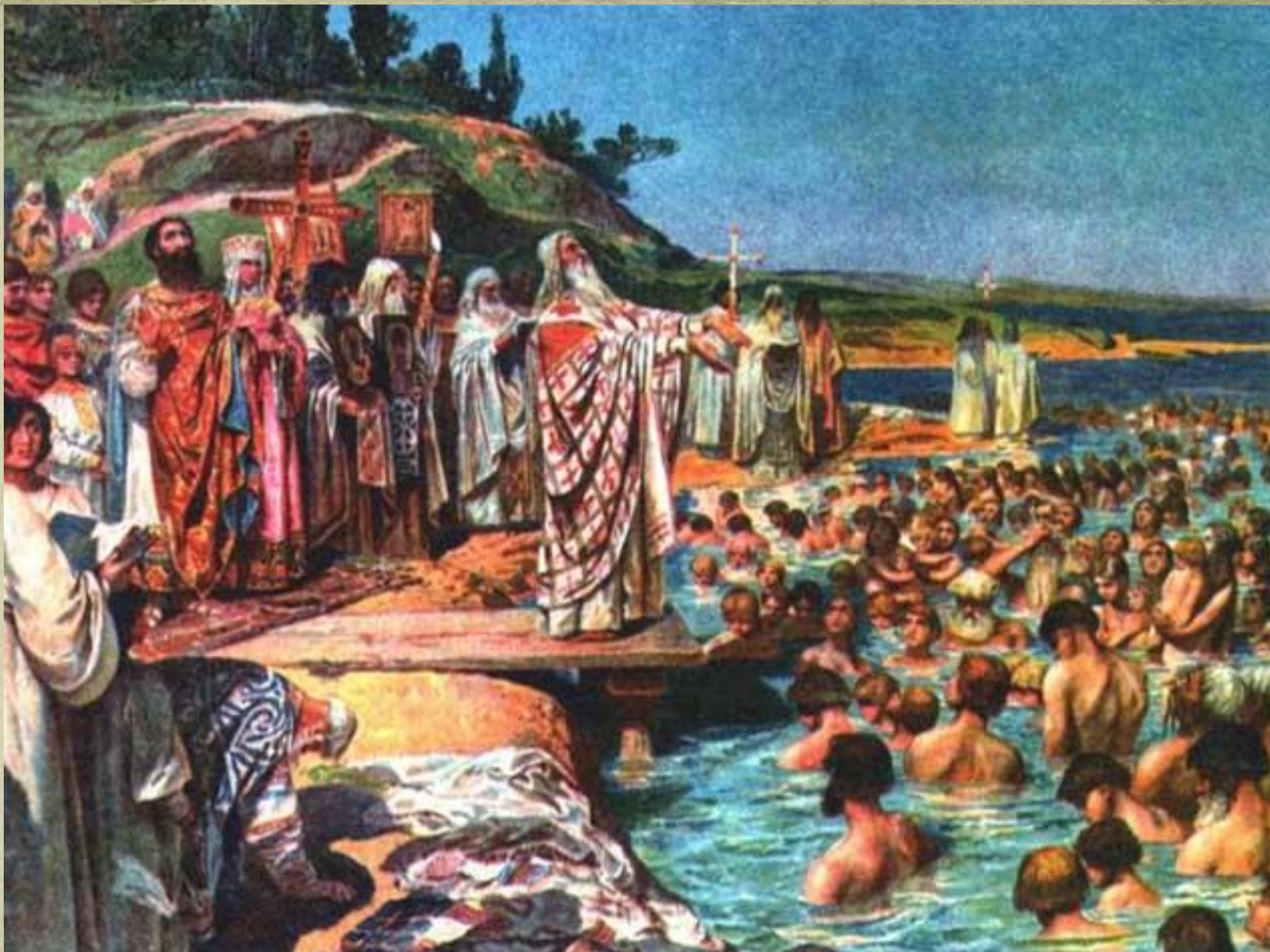
Лебедев К. «Крещение киевлян»