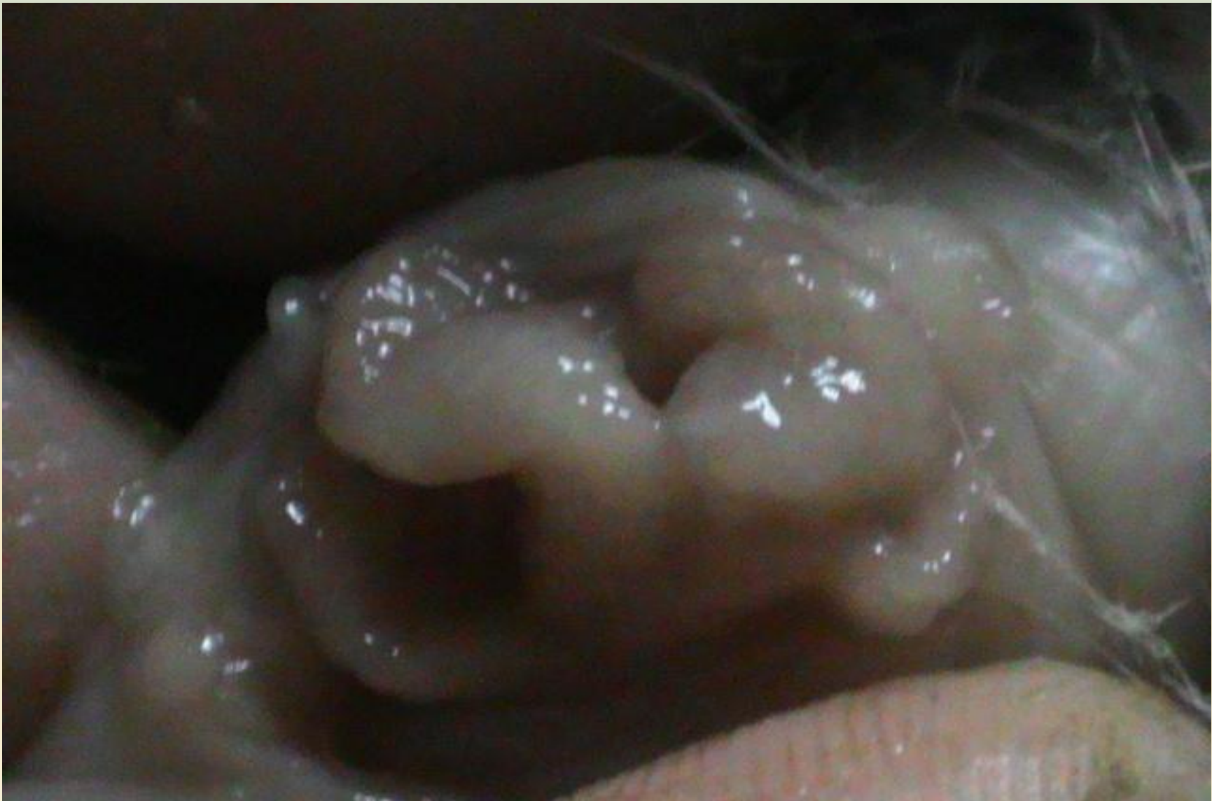
Қаз балапанының жыныстық мүшелері