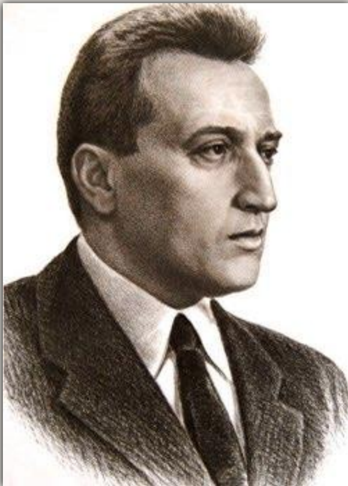
Джанни Родари (1920-1980)