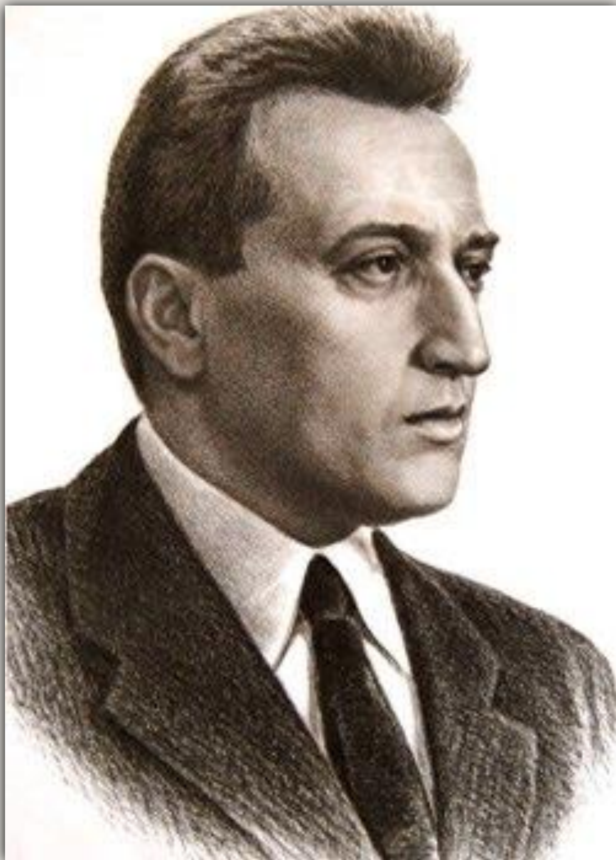
Джанни Родари (1920-1980)