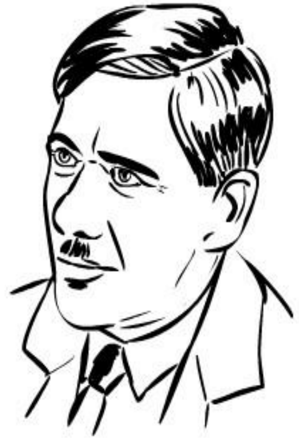
Корней Иванович Чуковский