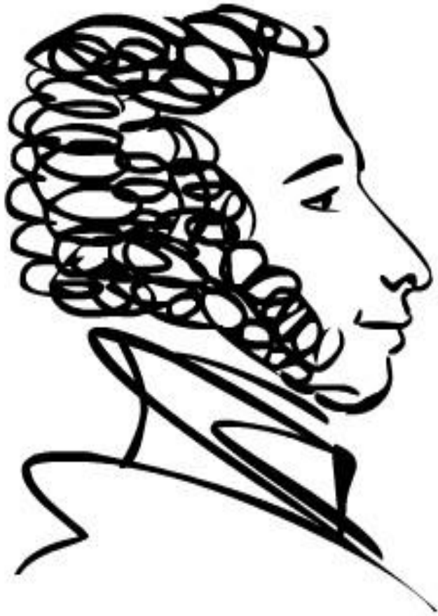
Александр Сергеевич Пушкин