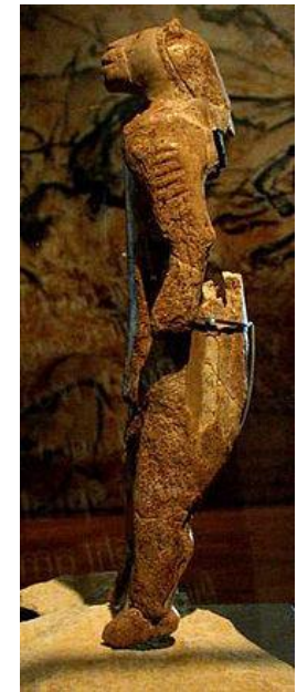
■ Человеколев-Швабский Альб, Германия