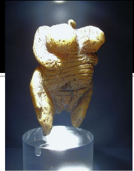
Венера из Холе-Фельс