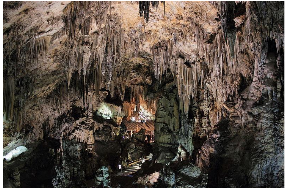
Охристый пигмент изображений испанской пещеры Нерха (43,5—42,3 тыс. лет)