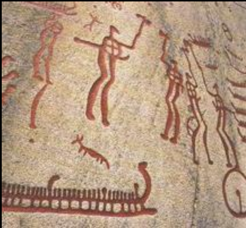
Наскальная живопись Скандинавии