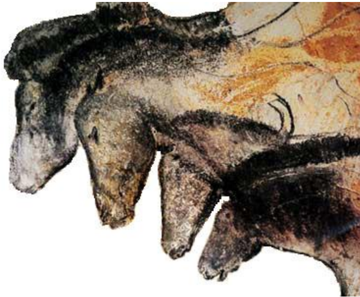
Тарпаны — изображение на стене пещеры Шове. (35,3—38,8 тыс. лет)