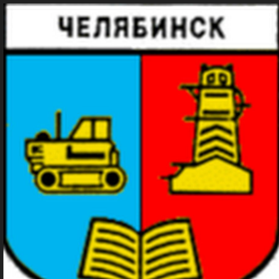
герб советского периода