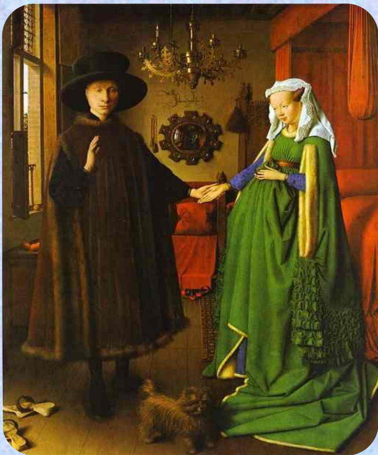
«Терпкий вкус жизни»