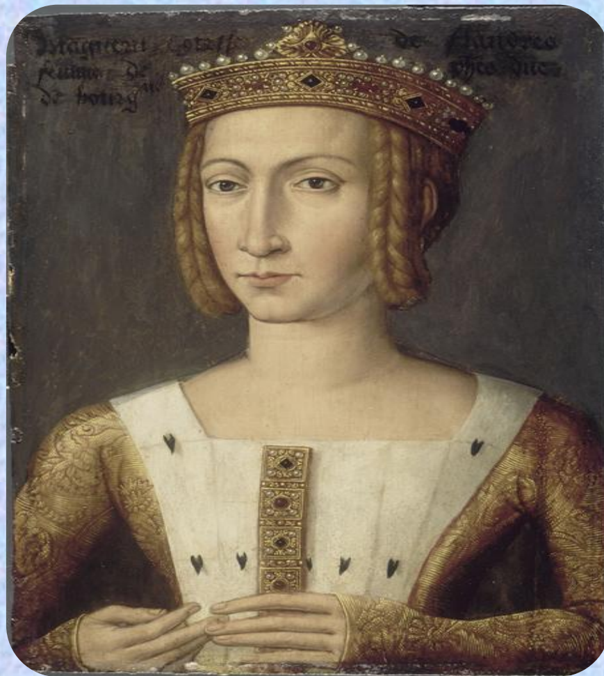
Жена Филиппа II Храброго