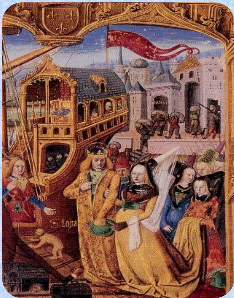
Людовик Святой с женой