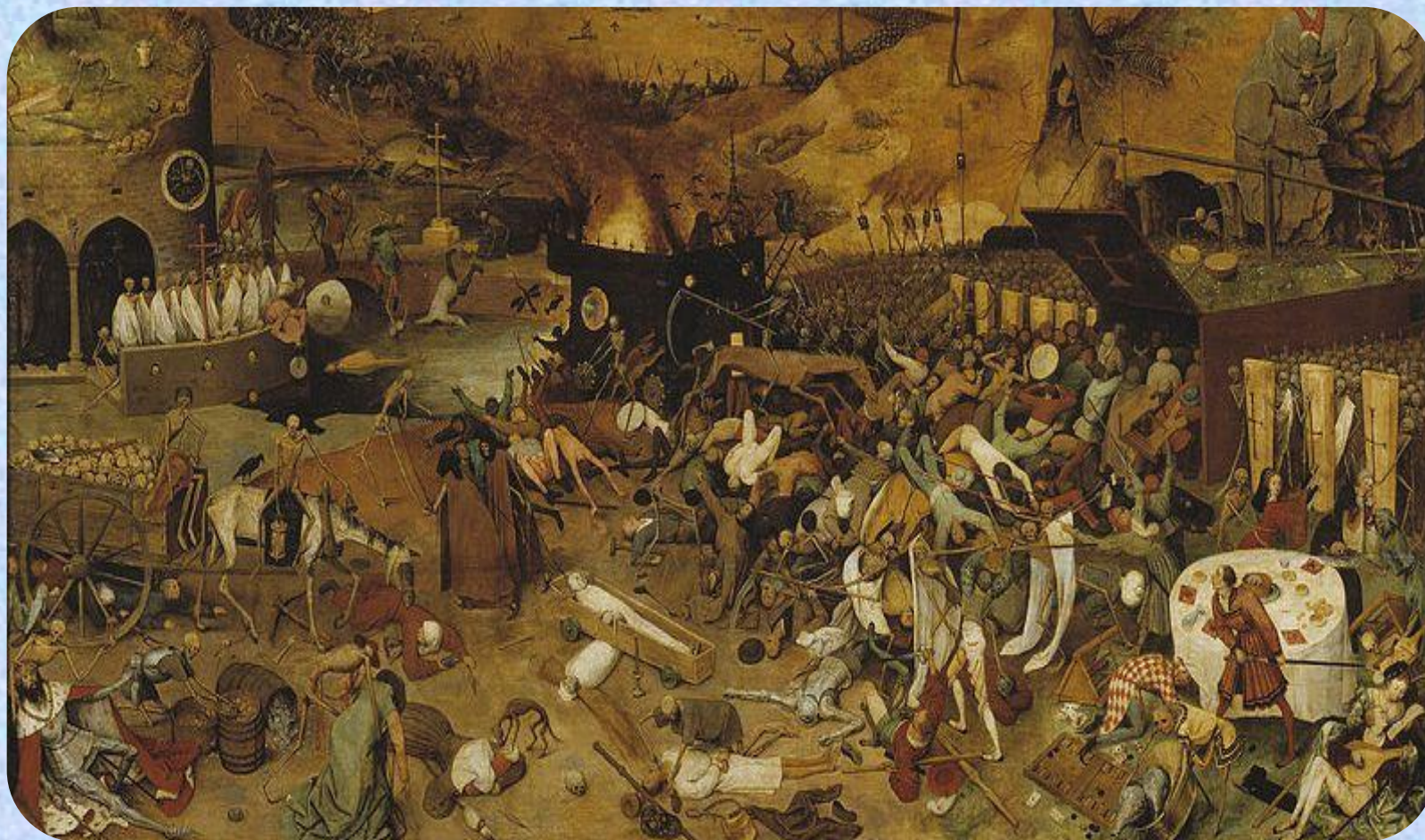
Эпидемия Бубонной чумы