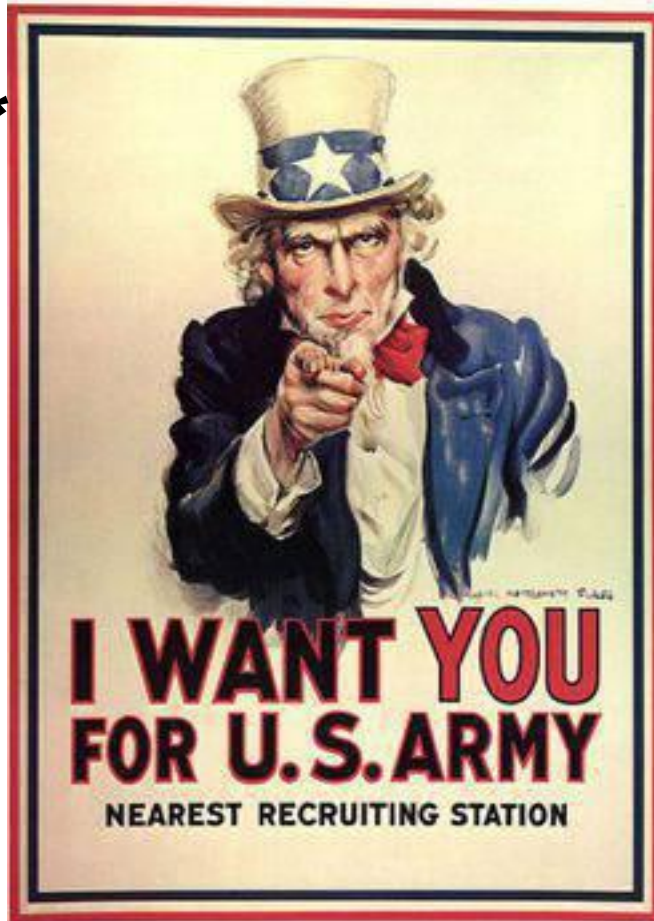
Плакат с “дядей Сэмом”*