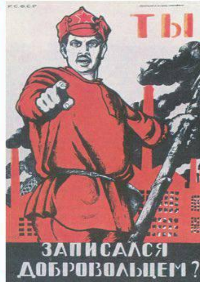
Плакат “Ты записался добровольцем?”

*Считается, что имя «Дядя Сэм» пошло от реального человека, бизнесмена Сэмюэля Уилсона. На бочках с говядиной, которые он поставлял армии во время войны 1812 года, стояли две буквы: U.S., это означало, что они являются государственной собственностью США (United States). U-uncle S-Sam uncle Sam в переводе на русский – дядя Сэм