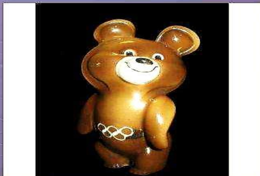
Символ Олимпийских игр 1980г.