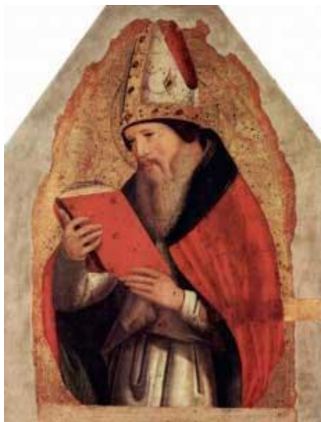
Августин Блаженный (354-430)