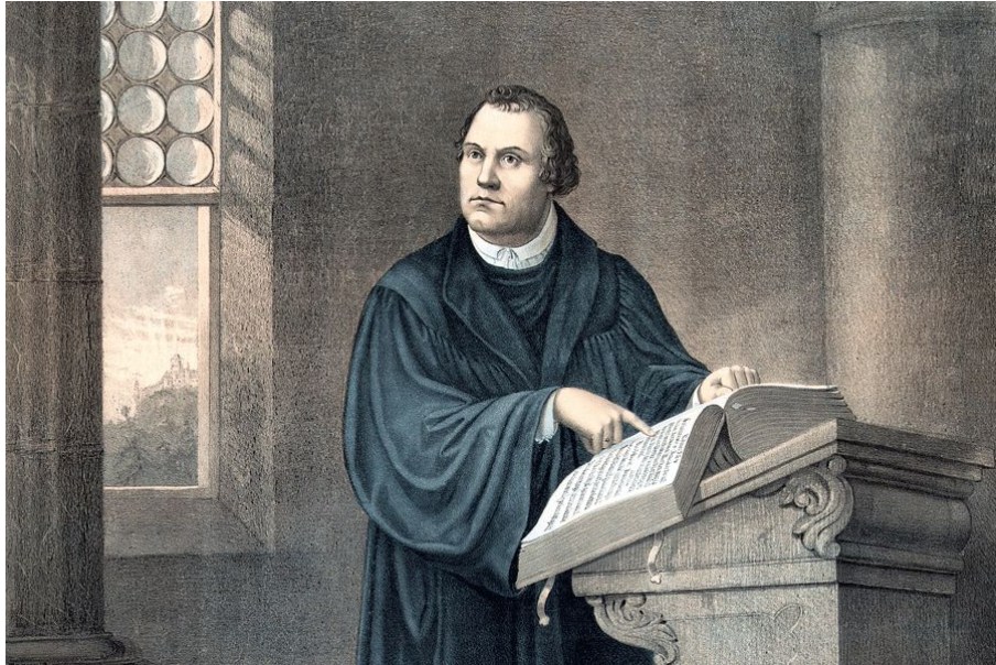
Мартин Лютер (1483-1546)