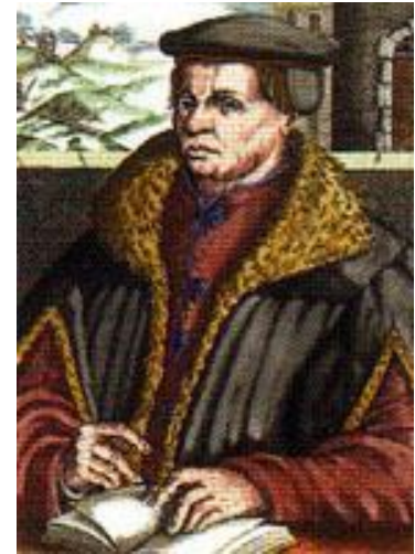
Томас Мюнцер (1489-1525)