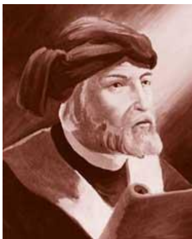
Тертуллиан Карфагенский, христианский богослов и мыслитель (160-220)