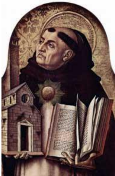
Фома Аквинский (1225-1274)