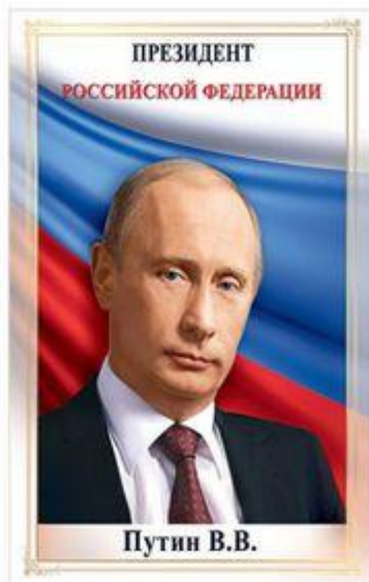
Владимир Владимирович Путин