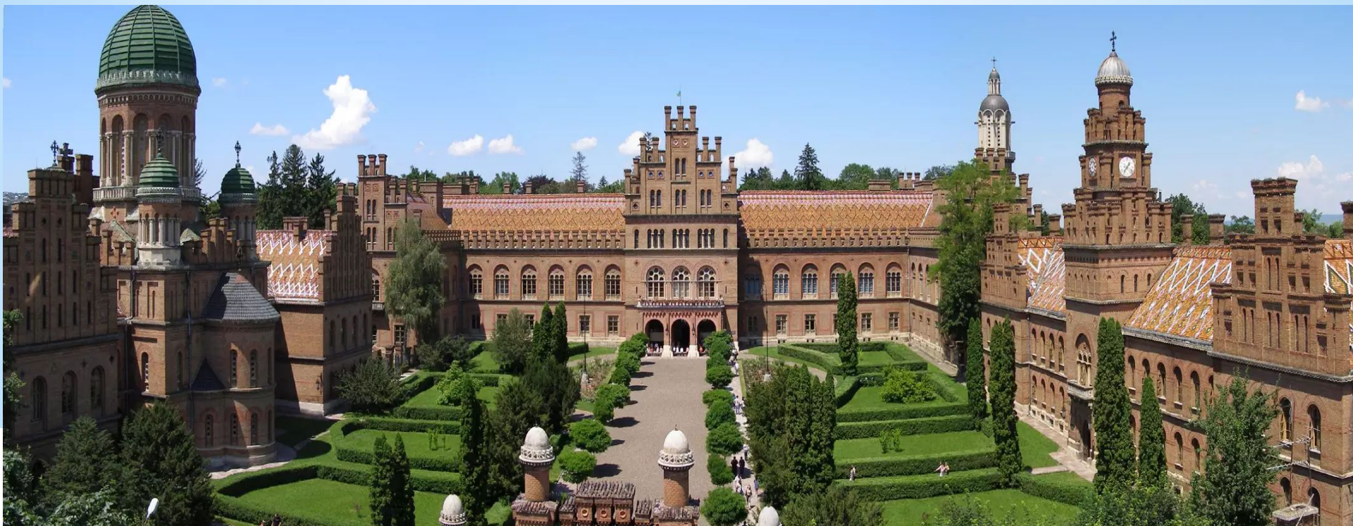
Резиденция митрополитов Буковины и Далмации 1864 – 1873 pp.