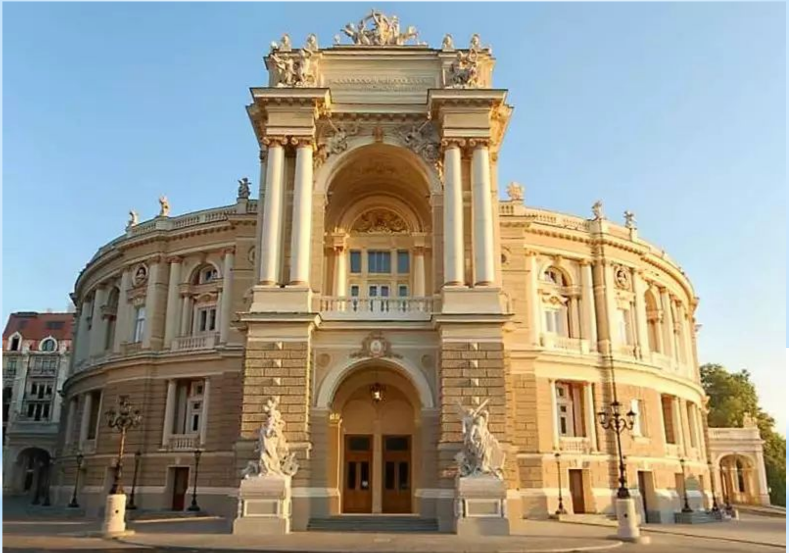
Одесский Театр Оперы и Балета 1883 – 1887 гг.