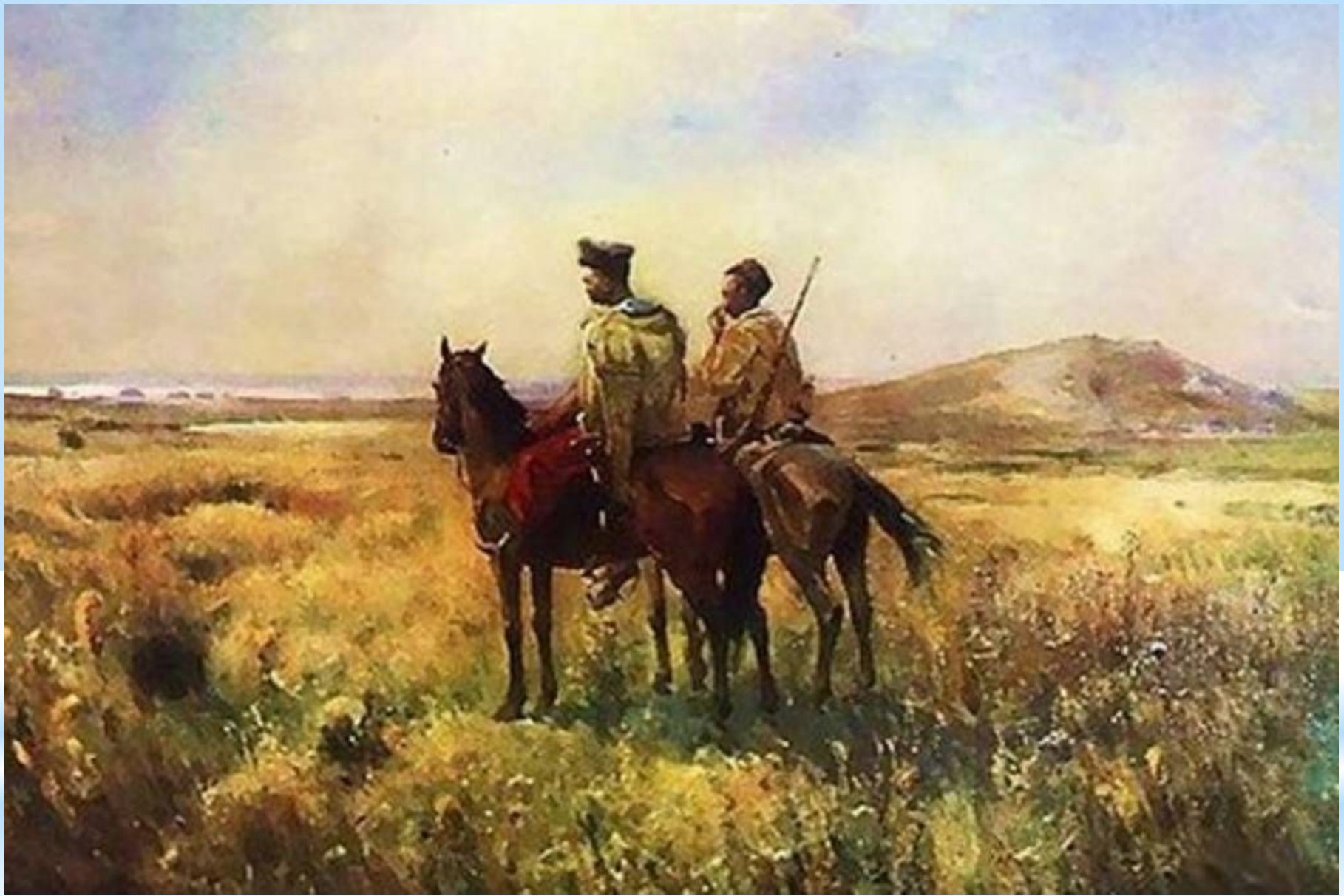
«Козаки в степу» 1890 р. С. Васильківський