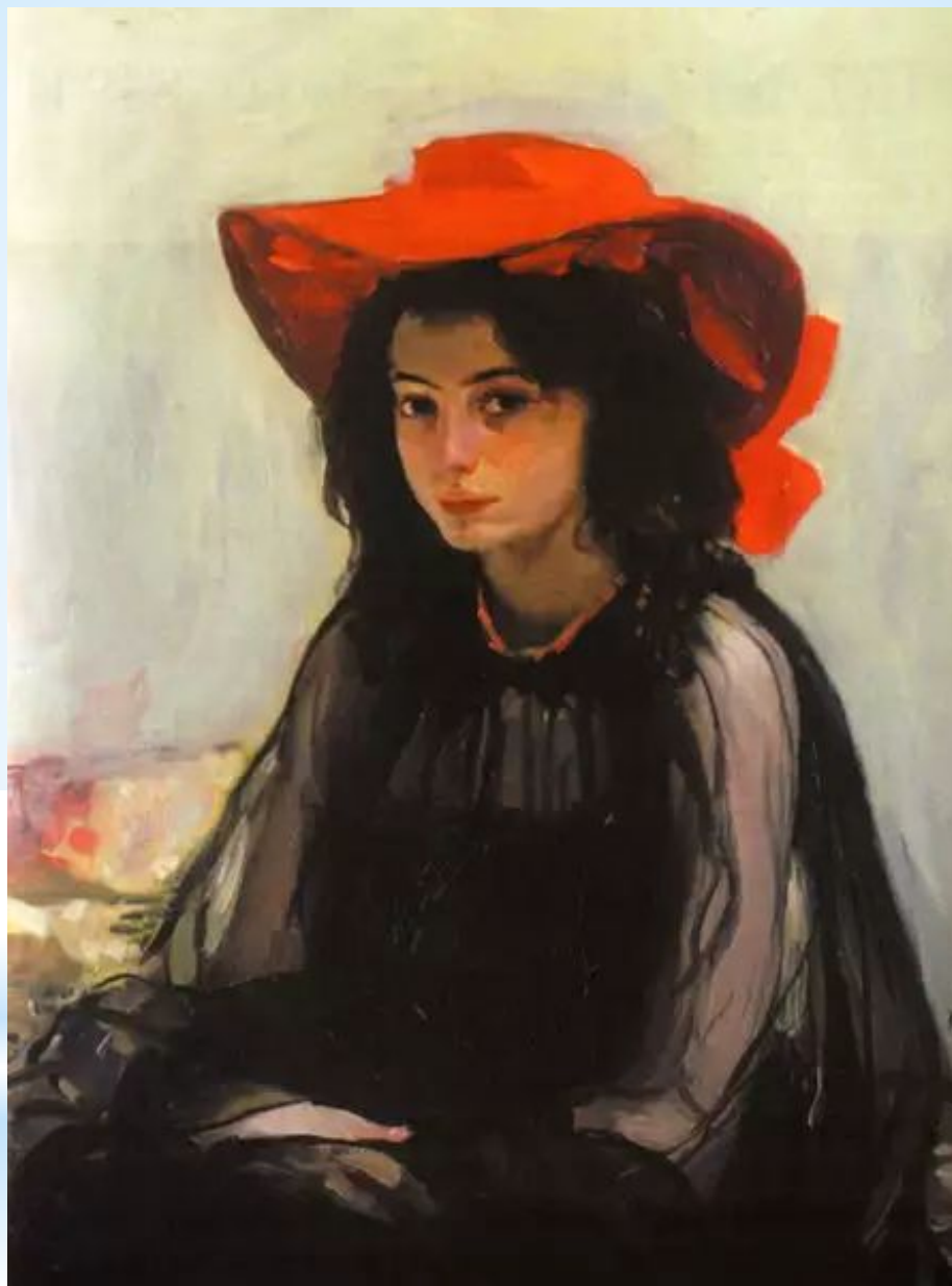
«Дівчина в червоному капелюсі» 1902 – 1903 рр. О. Мурашко