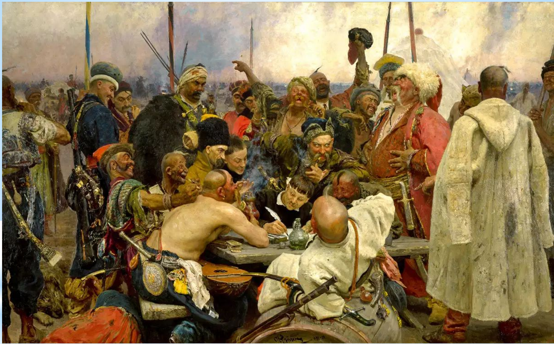
Запорожцы пишут письмо турецкому султану 1880 – 1891. И. Репин