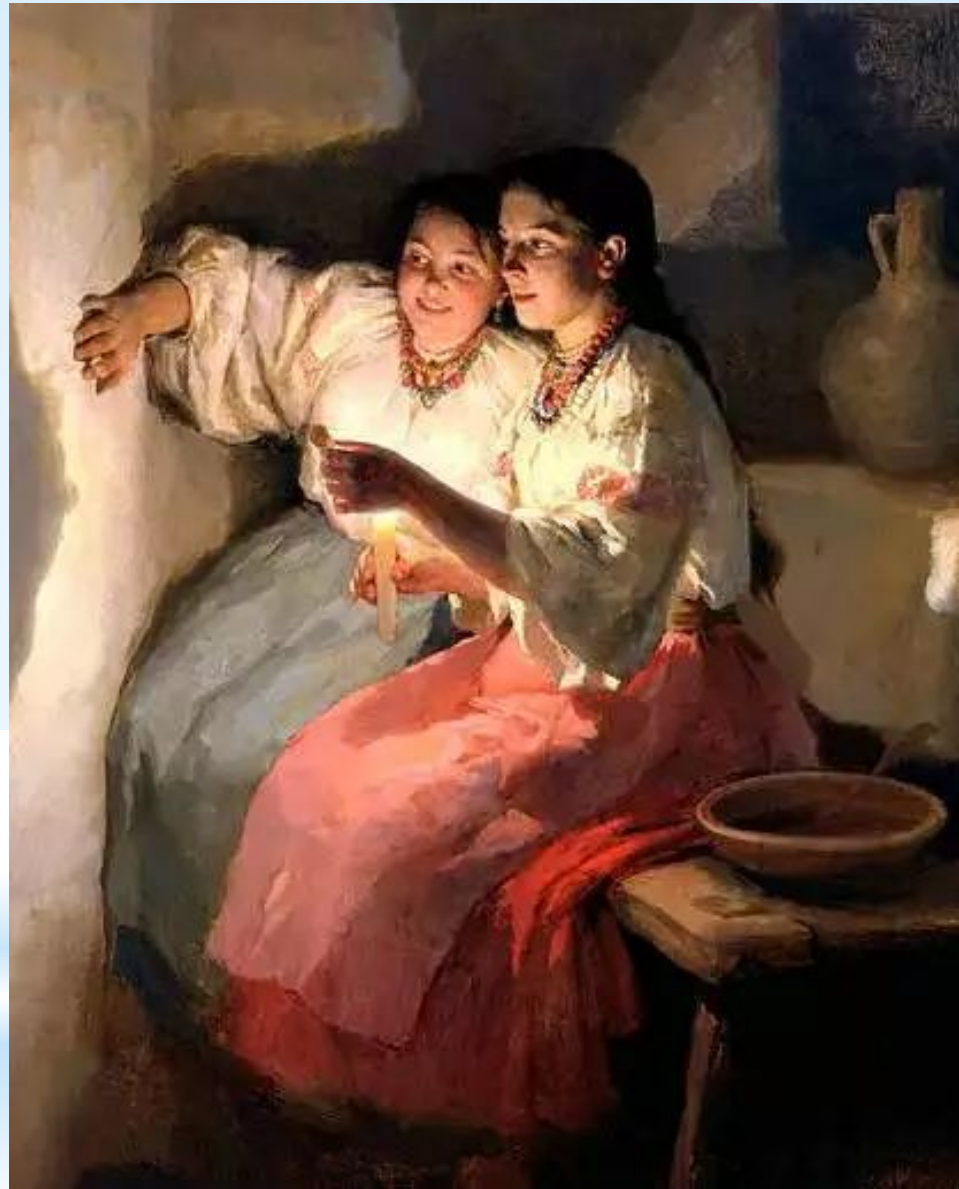
«Святочне ворожіння» 1888 р. М. Пимоненко