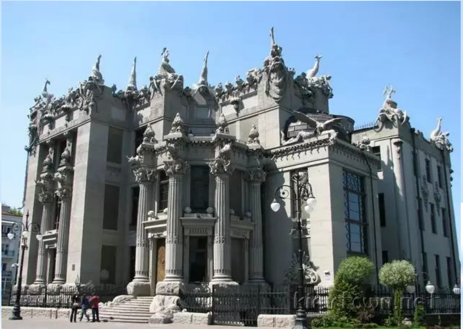
Будинок з химерами 1901 – 1903 рр.