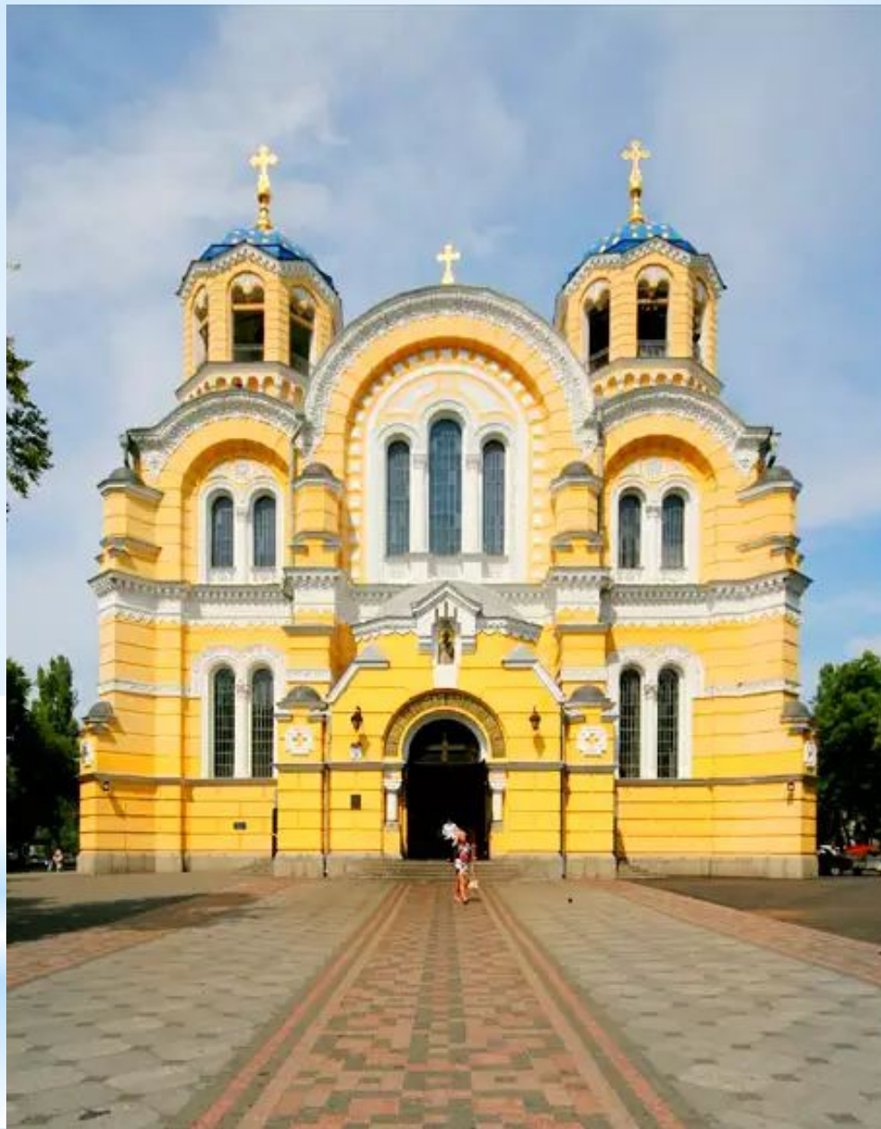
Володимирський собор 1862 – 1896 рр.