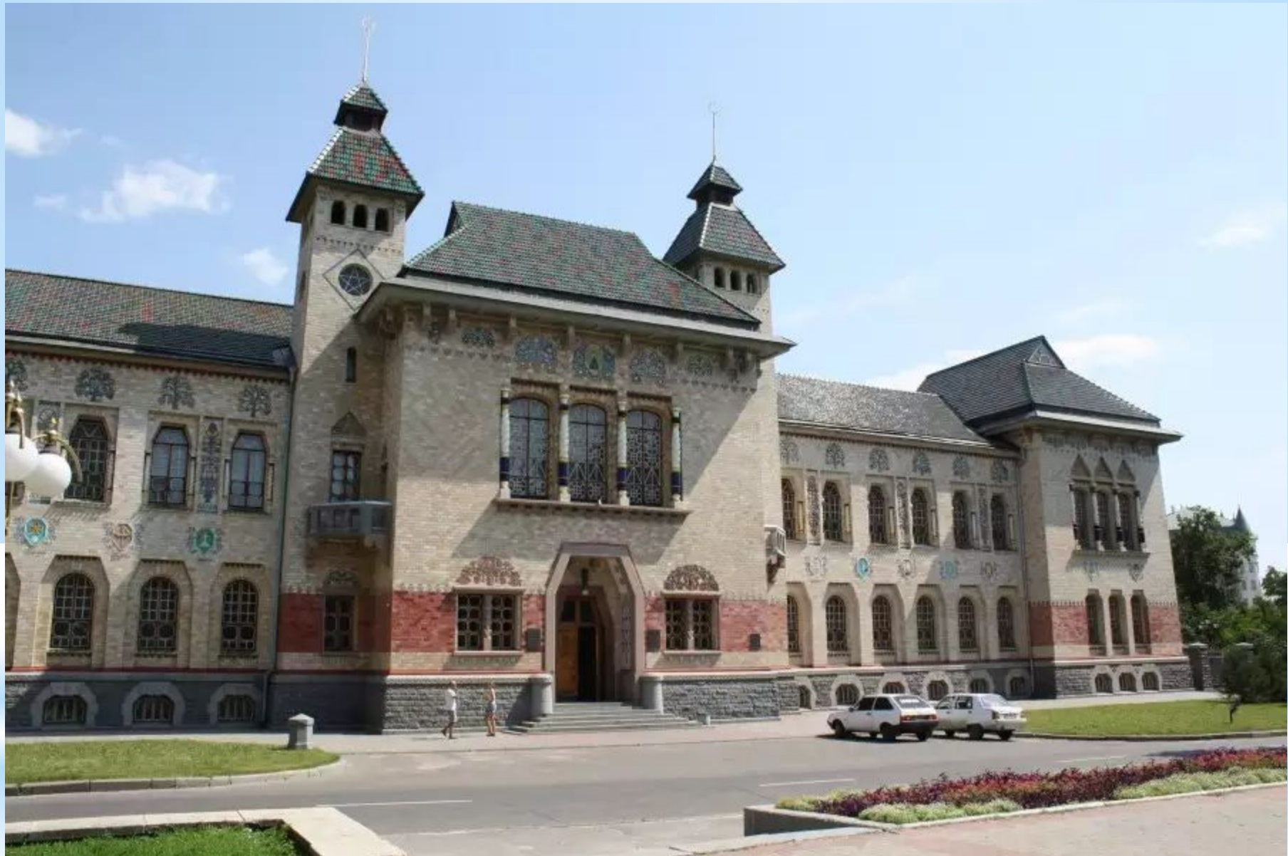
Будинок Полтавського губернського земства 1903 – 1908 рр.