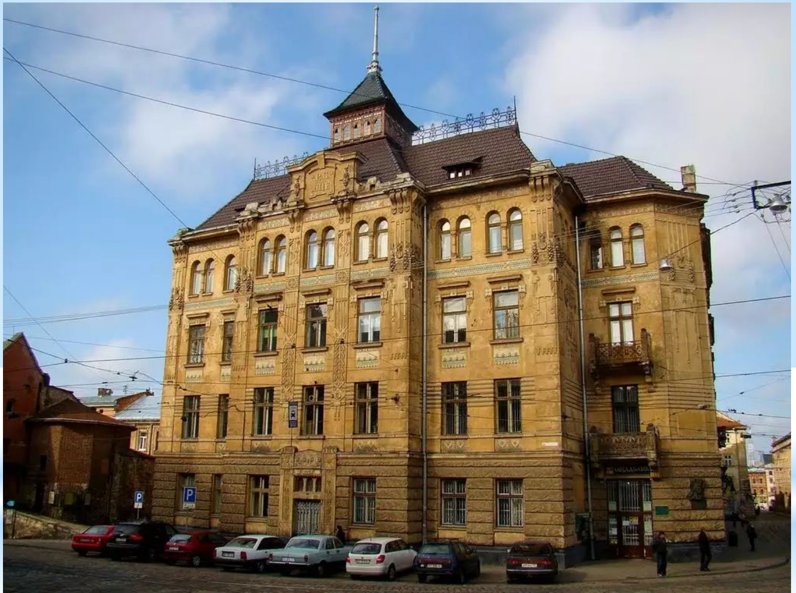
Будинок страхового товариства “Дністер” 1905 – 1906 рр.