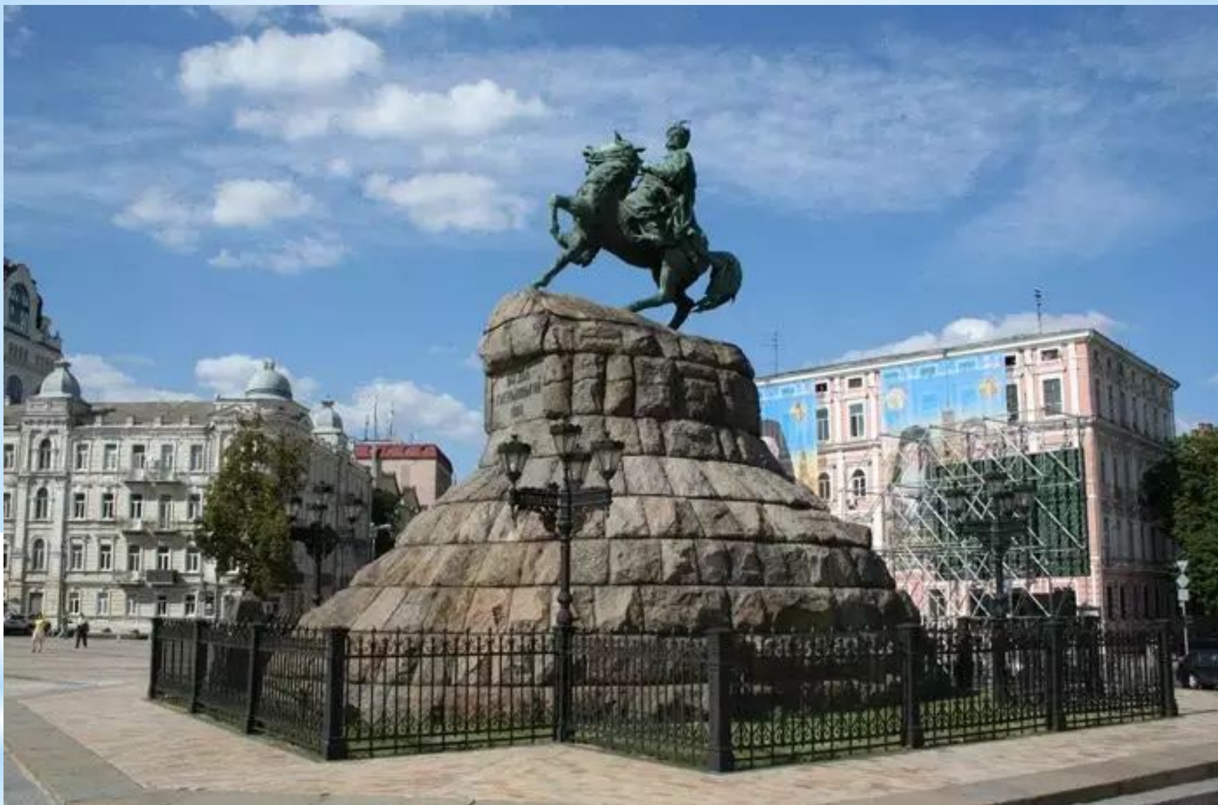
Пам'ятник Богдану Хмельницькому, Київ 1888 р. Скульптор М. Микешин