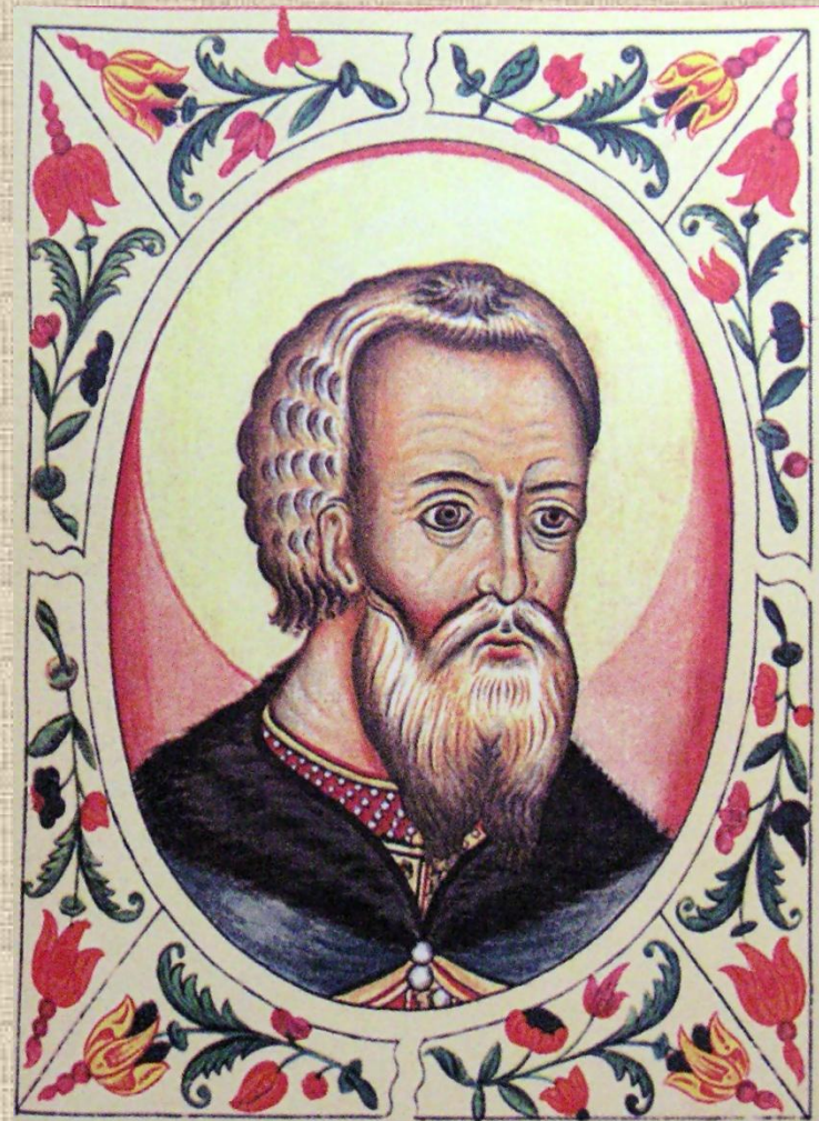
Государь всея Руси Василий Иоаннович