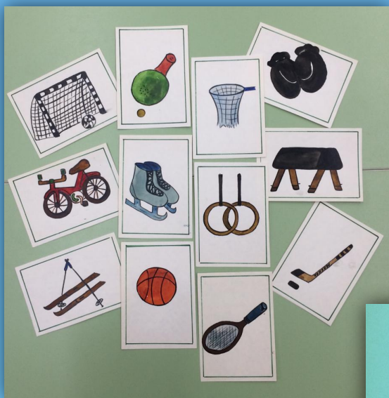
«Кому что нужно?»