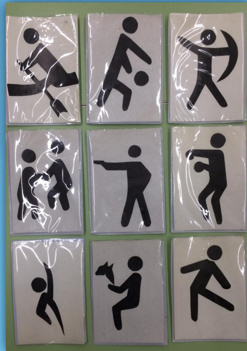
«Назови вид спорта»