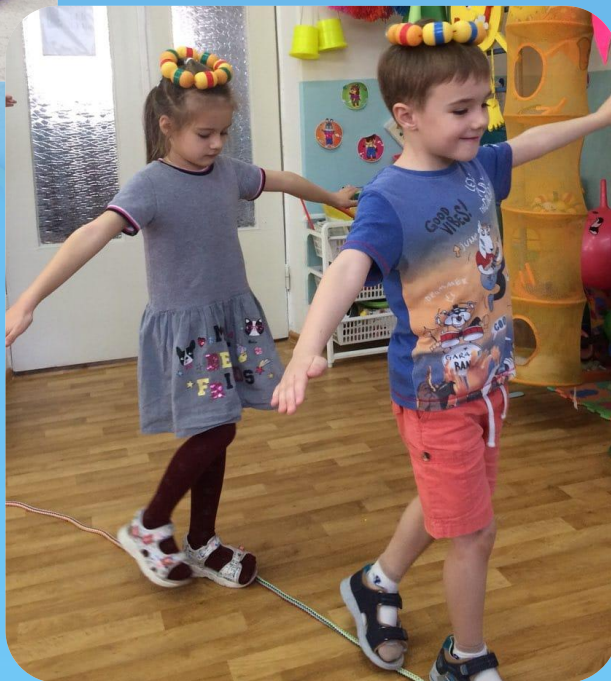
Тренажёр для равновесия