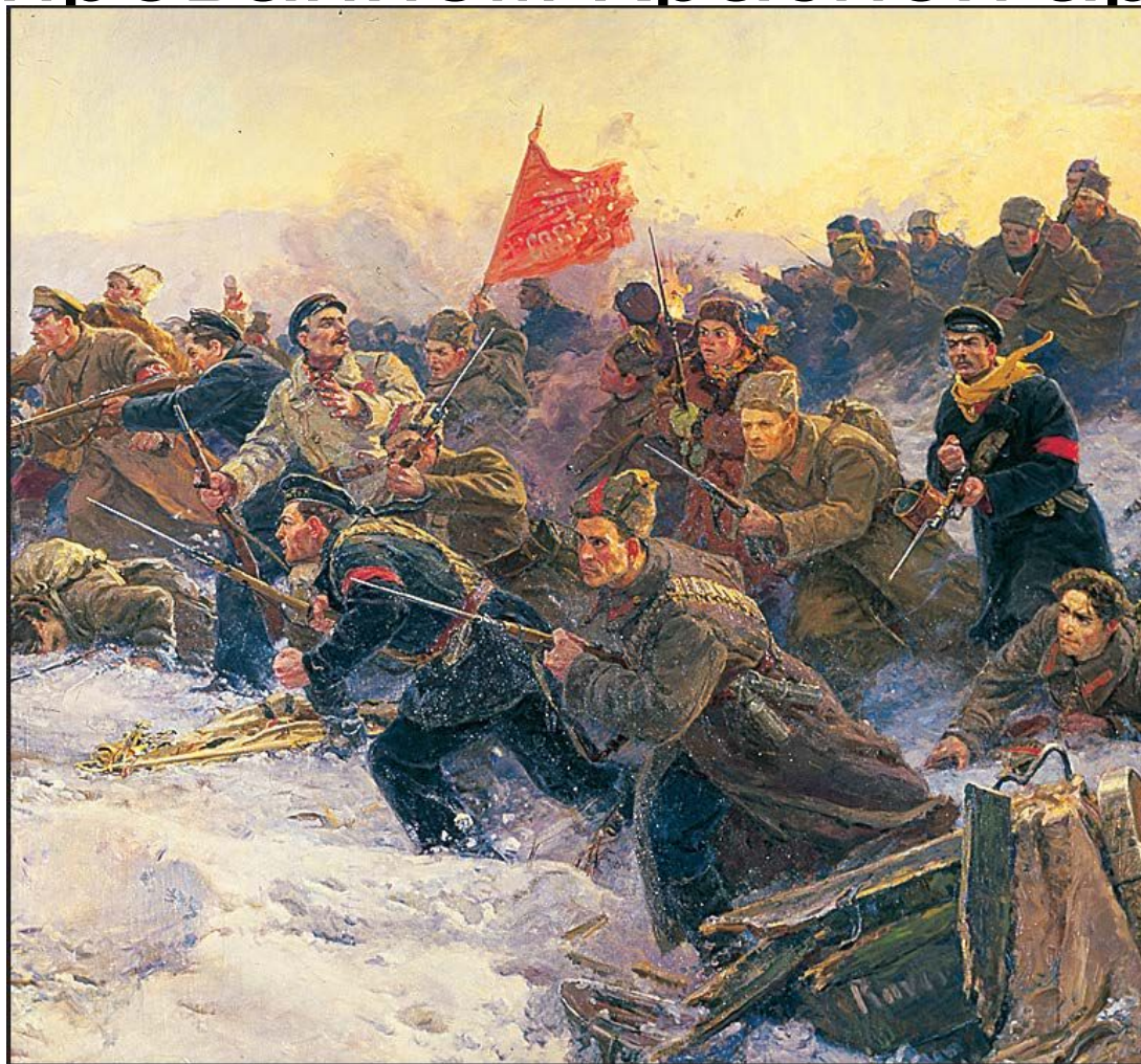
«Рождение Красной Армии». Художники В.К. Дмитриевский, Н.В. Евстигнеев, Г.И. Прокопинский. 1954 г.