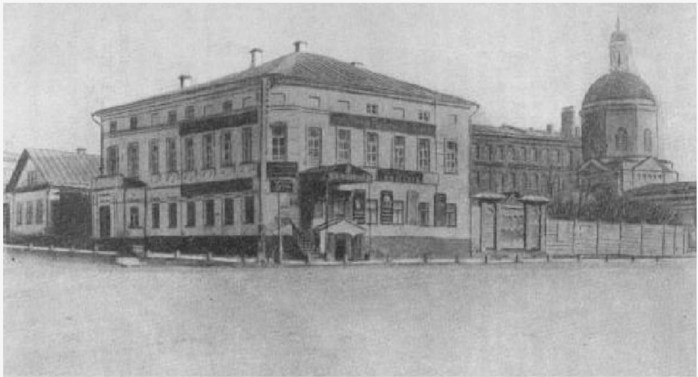
Дом в Симбирске, в котором родился И. А. Гончаров.