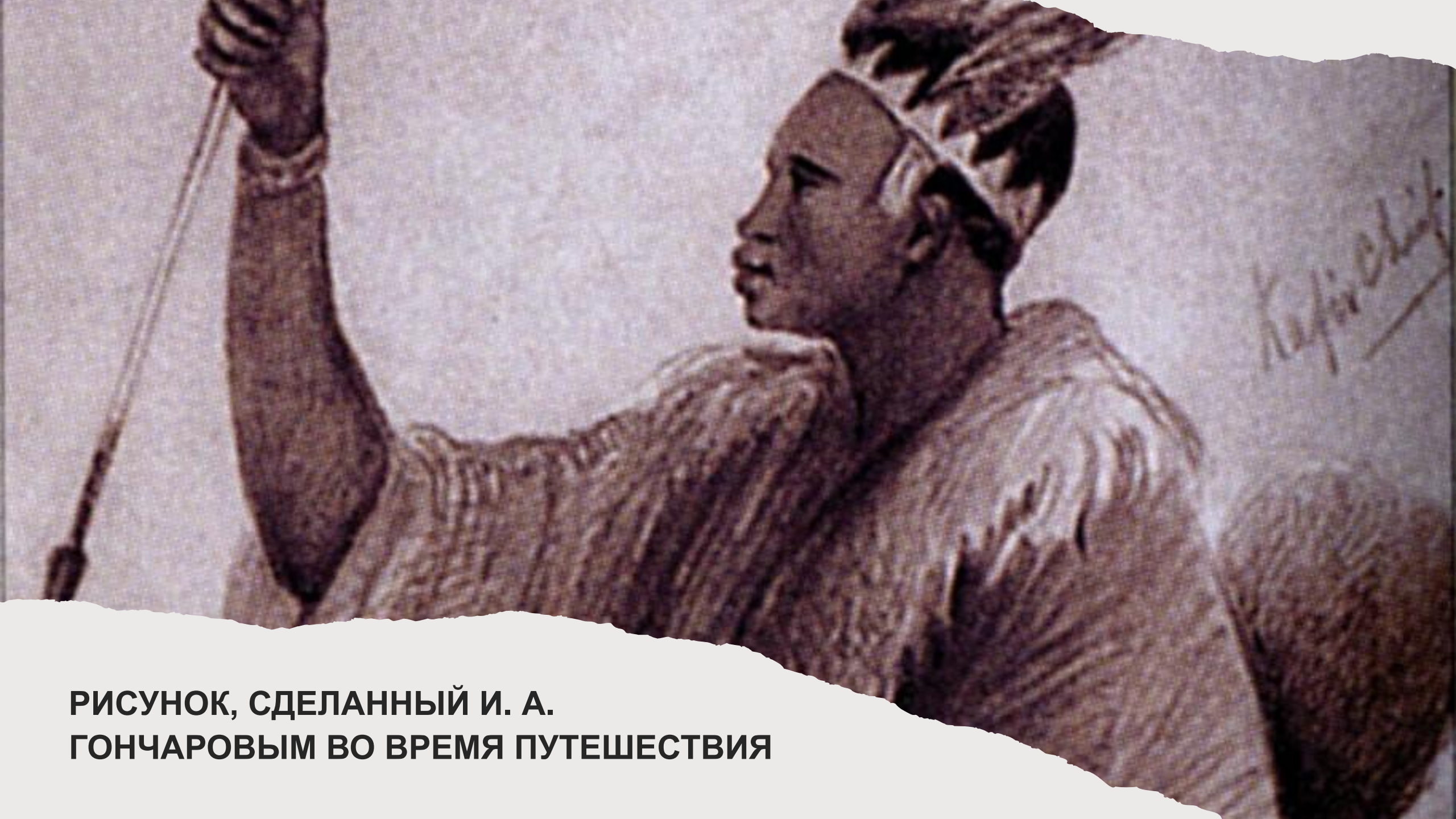
РИСУНОК, СДЕЛАННЫЙ И. А. ГОНЧАРОВЫМ ВО ВРЕМЯ ПУТЕШЕСТВИЯ