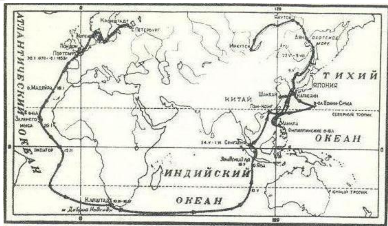
КАРТА ПЛАВАНИЯ ФРЕГАТА "ПАЛЛАДА"