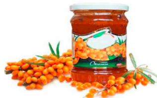
Использование сырья для приготовления варенья