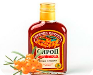
Использование сырья для приготовления сиропов