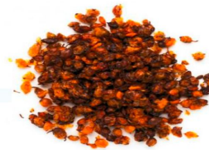
Реализация сушеных плодов