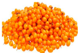
Реализация свежих ягод

На рынке становится все более востребованными лекарственные культуры. Особенно популярны целебные ягоды и растения местного производства. Облепиха – одно из таких растений, является достаточно продуктивной и не прихотливой в выращивании. Тем не менее, эту ягоду можно использовать не только в лечебных целях, но также реализовывать по таким направлениям: