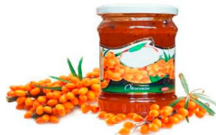
Использование сырья для приготовления варенья