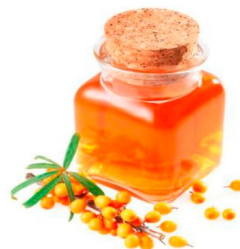
Изготовление облепихового масла