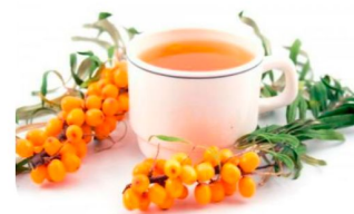
Производство чая из облепихи