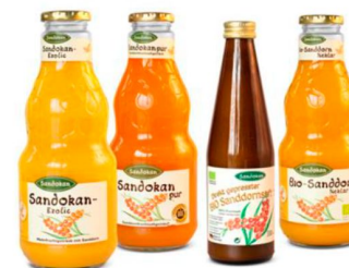
Переработка ягод для получения сока