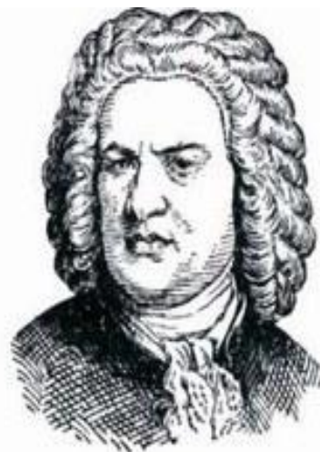
Иоганн Себастьян Бах