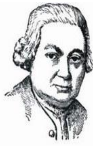
Карл Филипп Эмануэль Бах