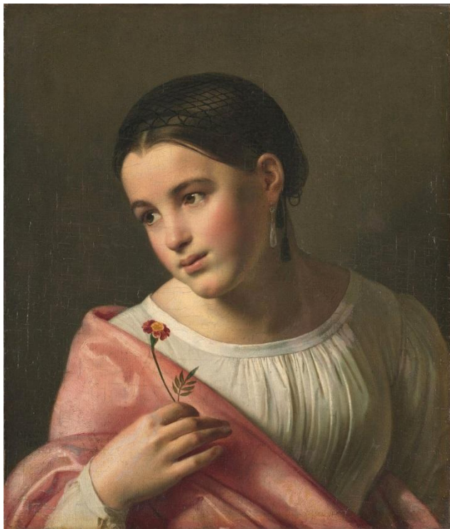
Орест Кипренский. Бедная Лиза (1827, Государственная Третьяковская галерея)