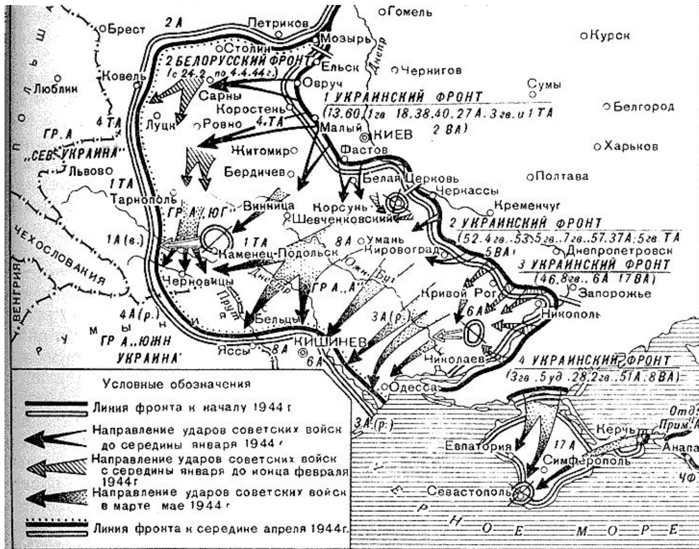
Освобождение Правобережной Украины и Крыма