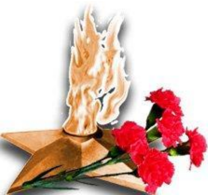
Освобождение Правобережной Украины и Крыма