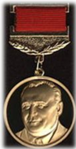
2010 г. Медаль им. С.П.Королёва «За вклад в развитие космонавтики»