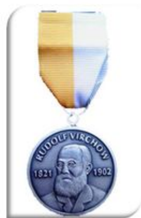
2012, Ганновер, Германия