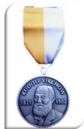
2012, Ганновер, Германия

Медаль им. Рудольфа Вирхова Европейской Академии Естественных Наук – за разработку медицинской аппаратуры