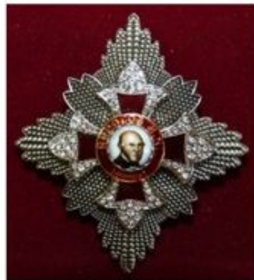
2011 г. Орден им. Пирогова Н.И. за разработку инновационного метода скрининг-диагностики «РОФЭС» и внедрении его в систему здравоохранения.