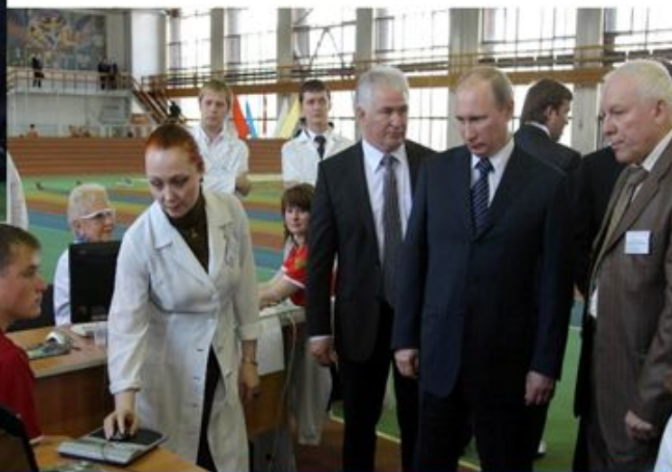
Кубанский государственный университет физкультуры, спорта и туризма. Президенту Путину В.В. демонстрируют работу прибора РОФЭС