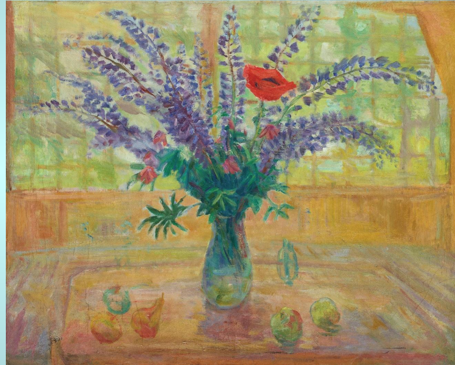
«Лупинусы и мак»