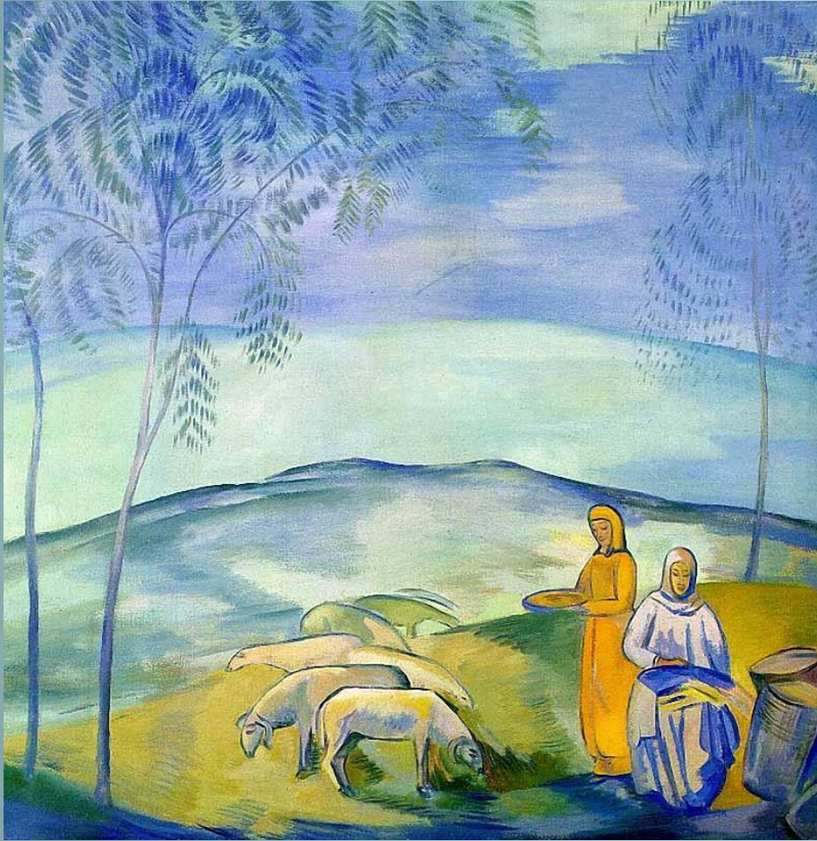
«В степи» 1917 г.