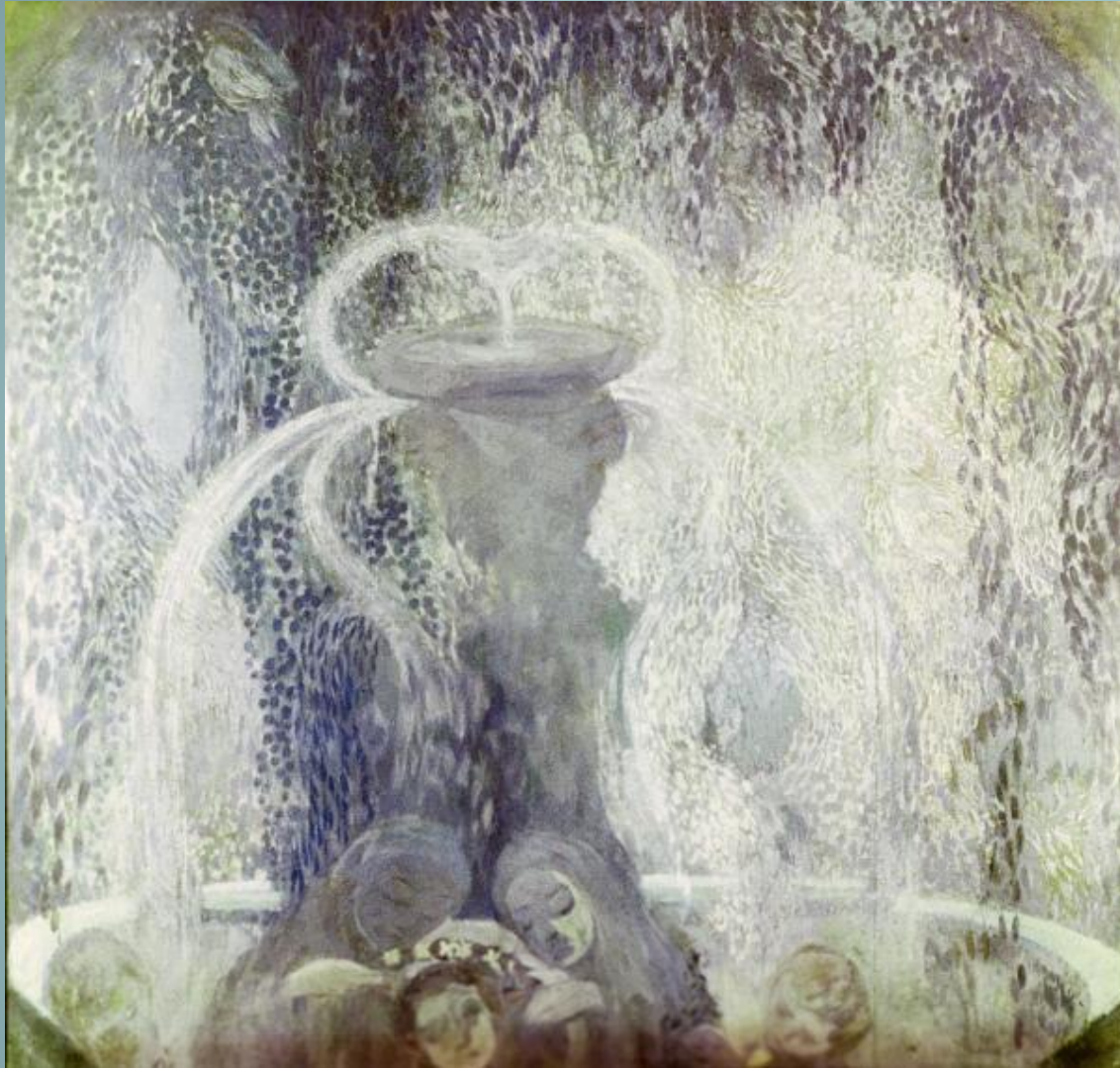
Голубой фонтан, 1905