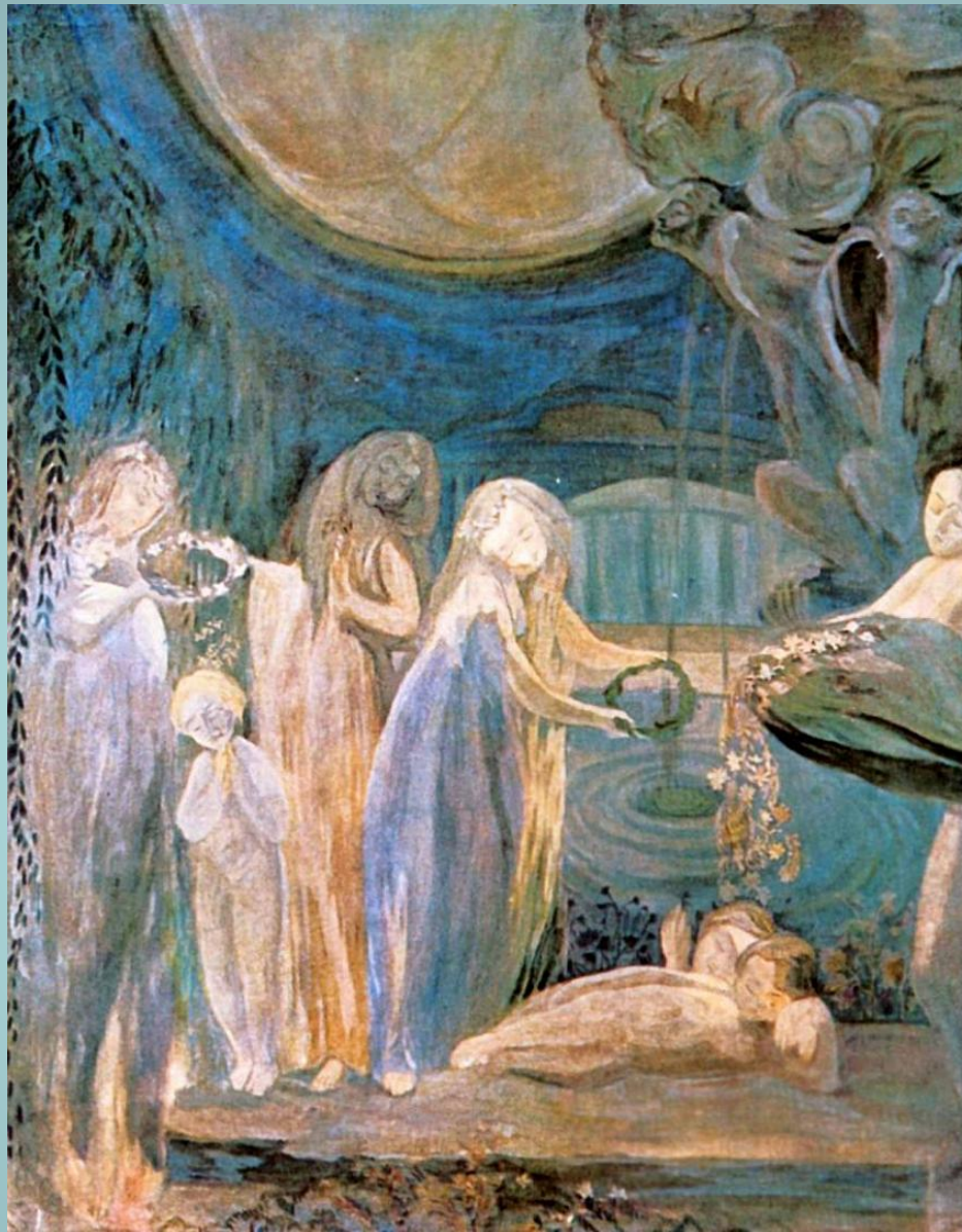
«Любовь матери» 1905 год