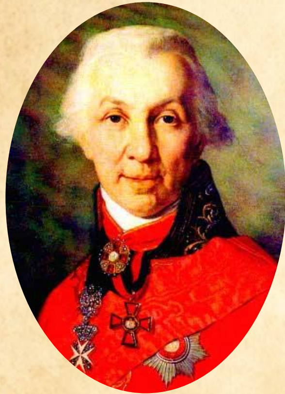
Г. Р. Державин