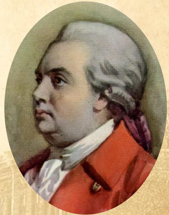
Д. И. Фонвизин