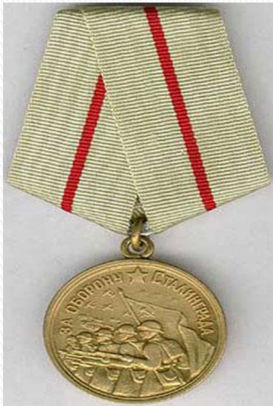
Медаль «За оборону Сталинграда» / 22.12. 1942 г.