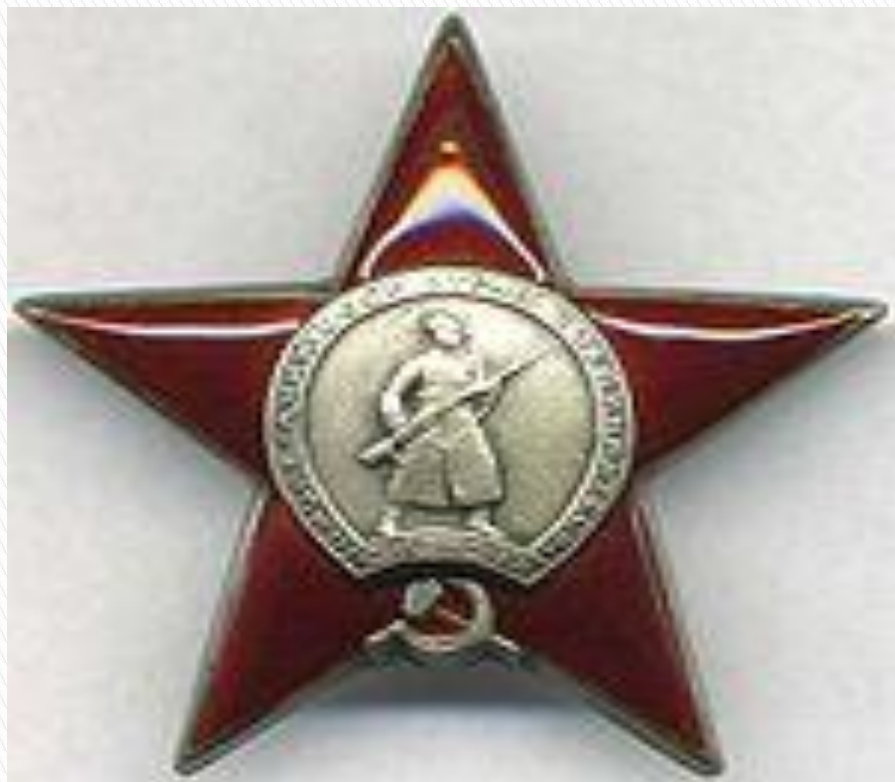
Орден Красной звезды / 25.10.1943 г.