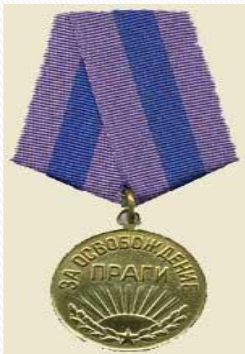
Медаль «За освобождение Праги» / 09.06. 1945 г.