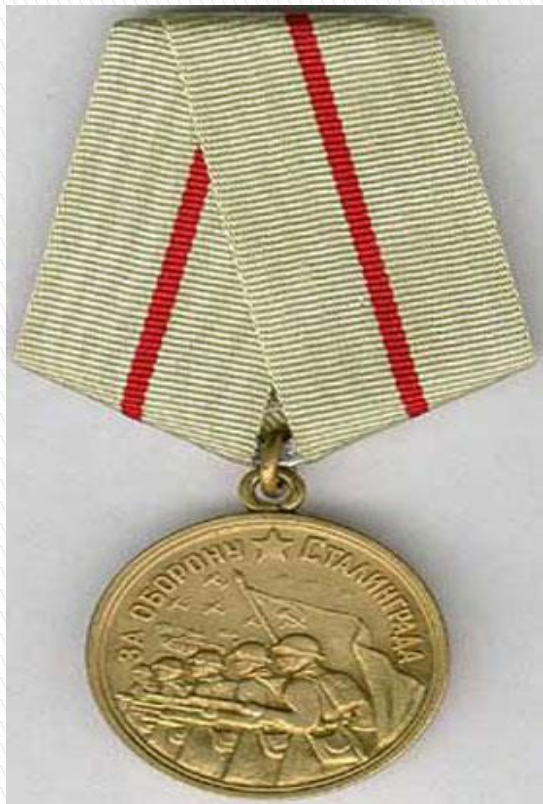
Медаль «За оборону Сталинграда» / 22.12. 1942 г.