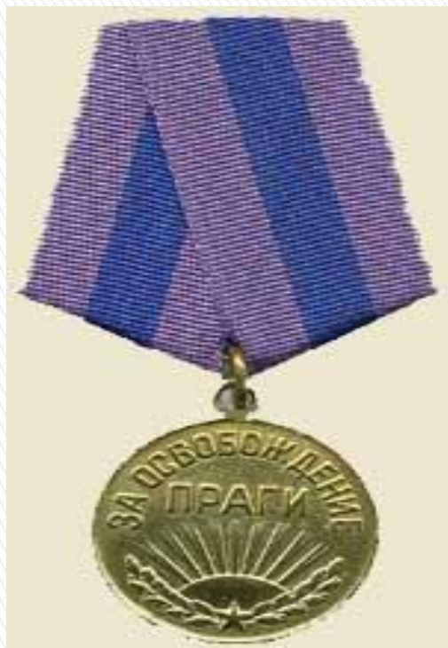
Медаль «За освобождение Праги» / 09.06. 1945 г.