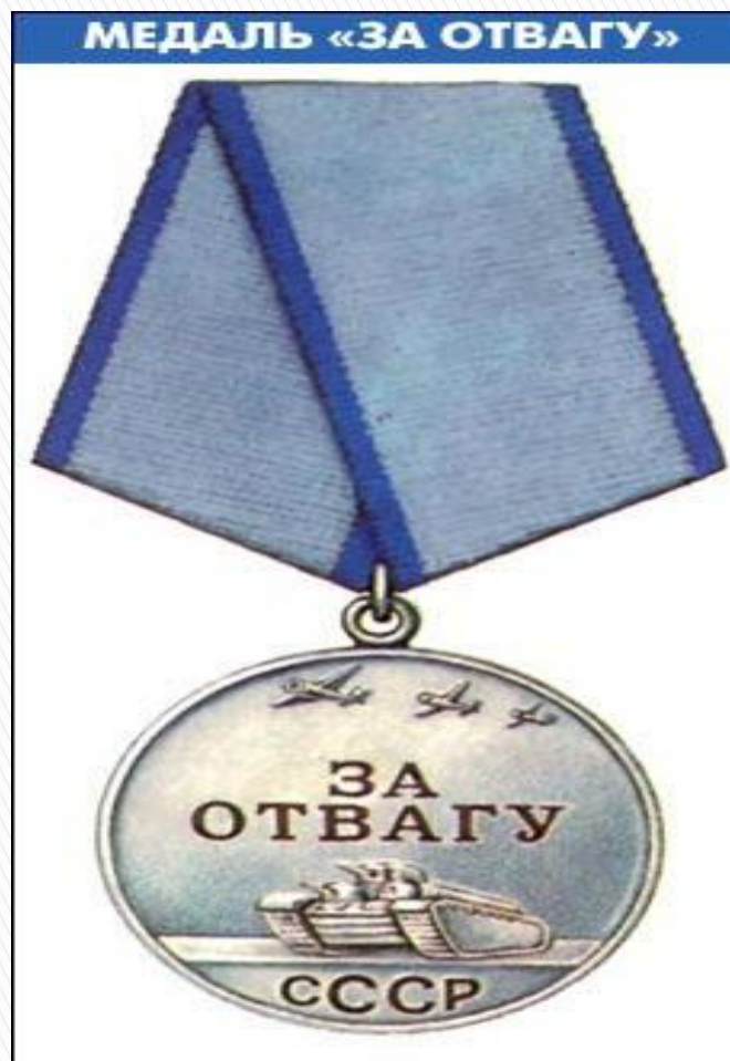
Медаль «За отвагу» 12.01. 1943 г.