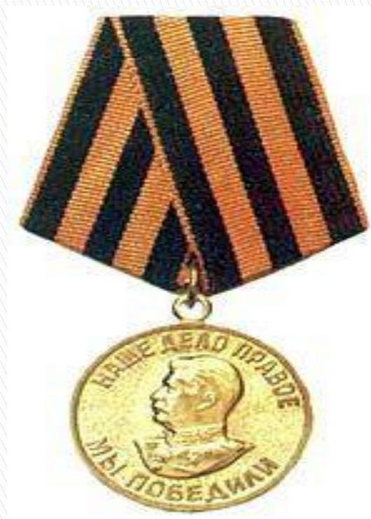
Медаль «За победу над Германией»