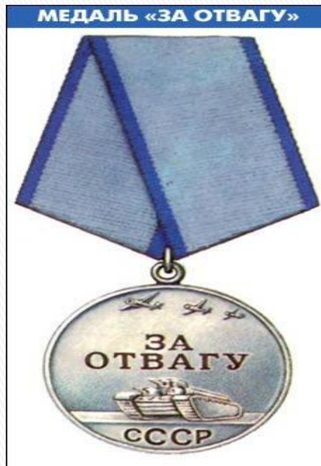
Медаль «За отвагу» 12.01. 1943 г.