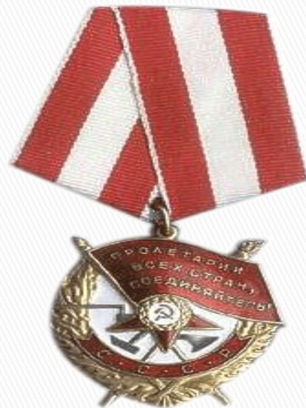
Орден Красного Знамени / 28.04.1944г.