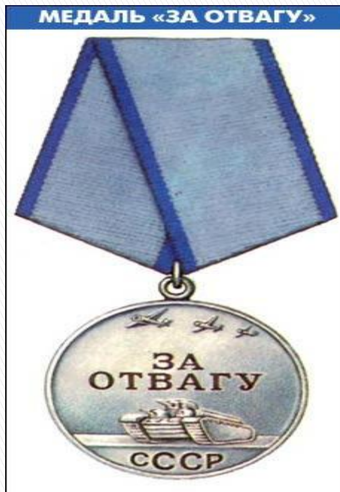
Медаль «За отвагу» 12.01. 1943 г.