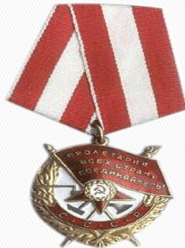
Орден Красного Знамени / 28.04.1944г.