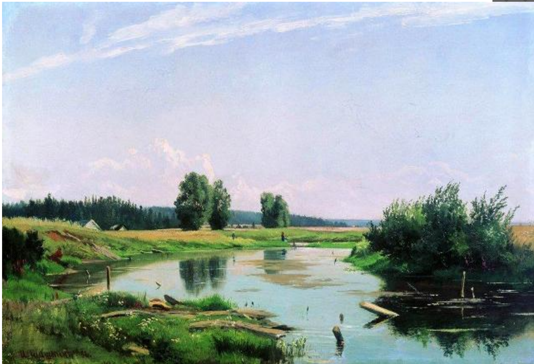
И.ШИШКИН ПЕЙЗАЖ С ОЗЕРОМ