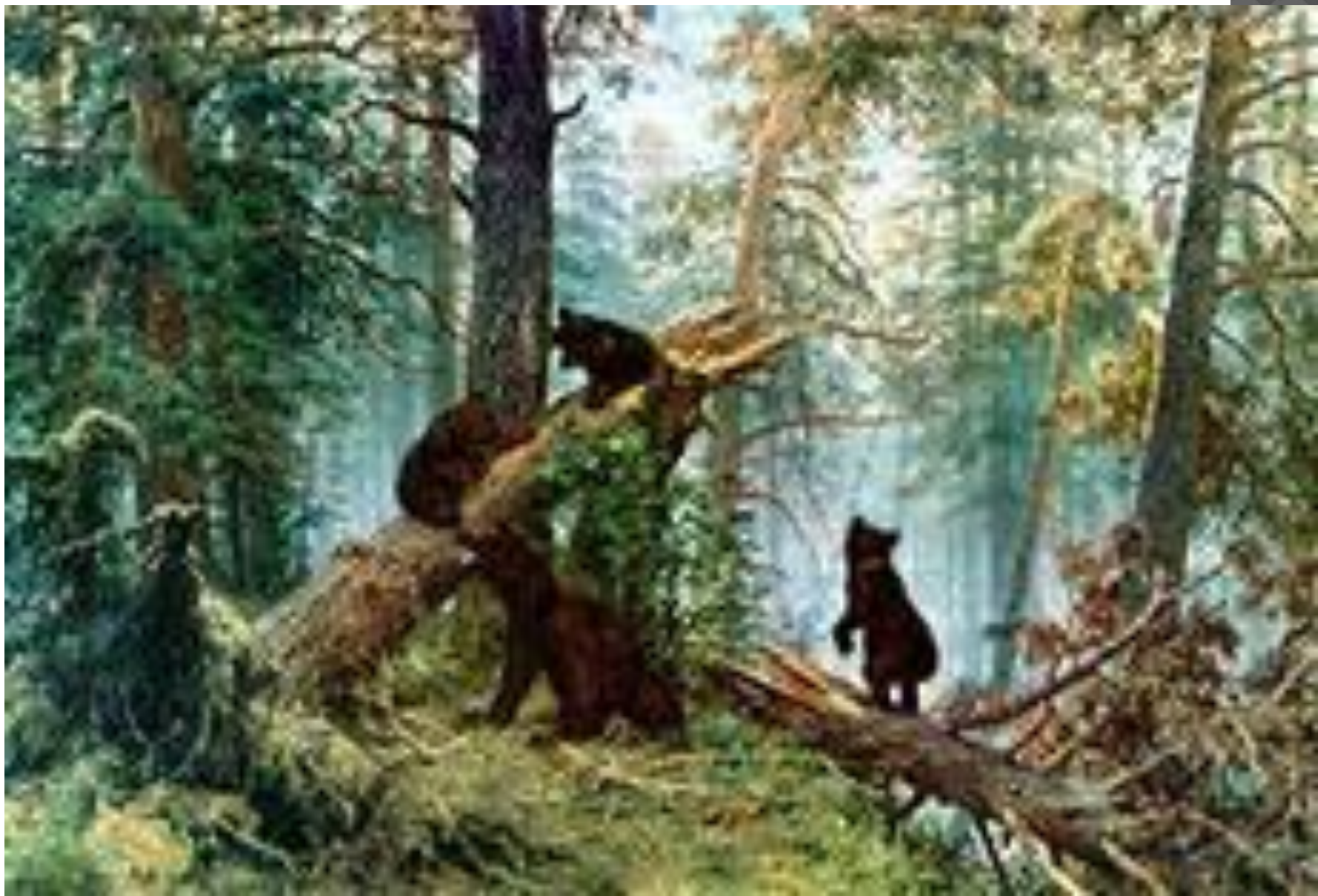
И. ШИШКИН «УТРО В СОСНОВОМ ЛЕСУ»