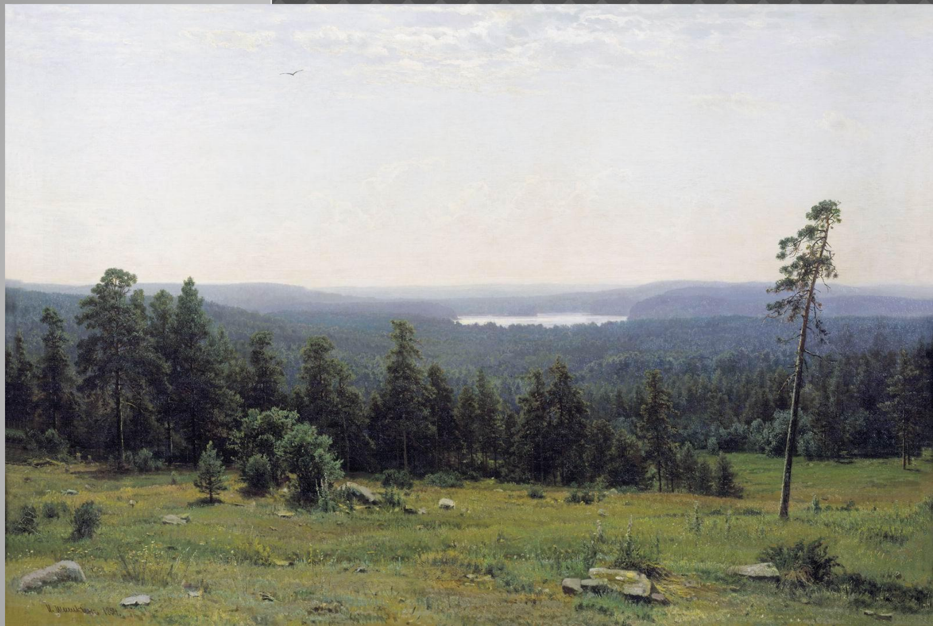
И. Шишкин «Лесные дали»