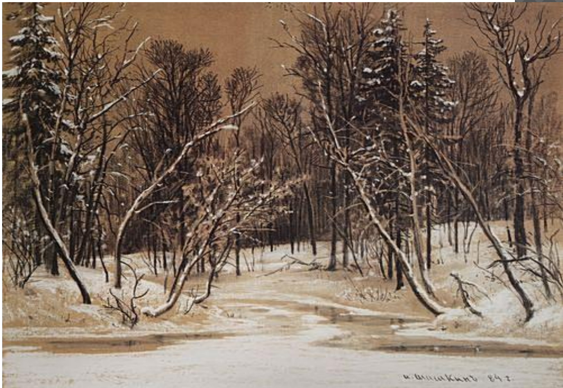
И. ШИШКИН «ЛЕС ЗИМОЙ»