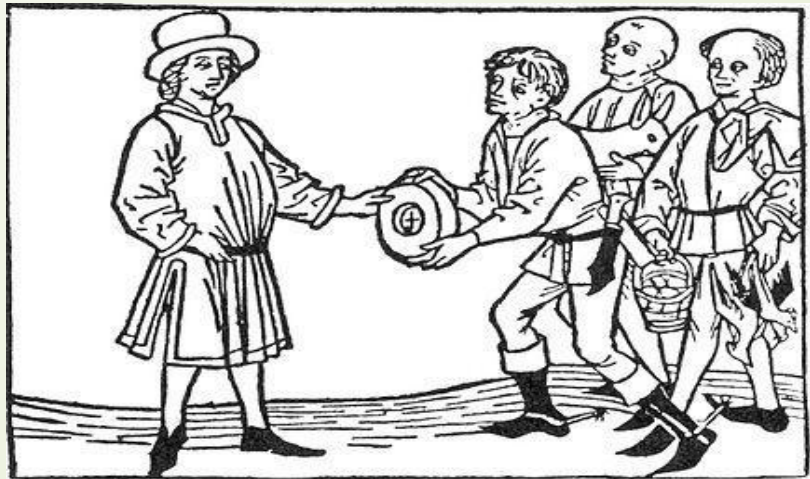
Bauern leisten Abgaben (Holzschnitt, um 1447)