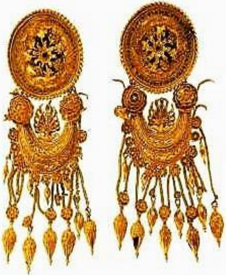
Золоті підвіски з кургану Куль-Оба