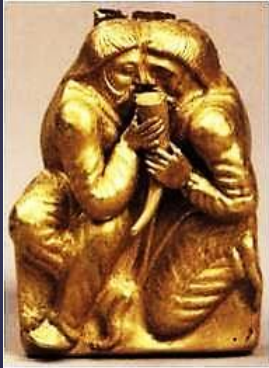
Бляха з зображенням сцени побратимства скіфів