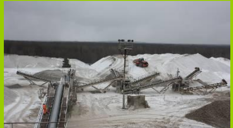
Разработка полезных ископаемых