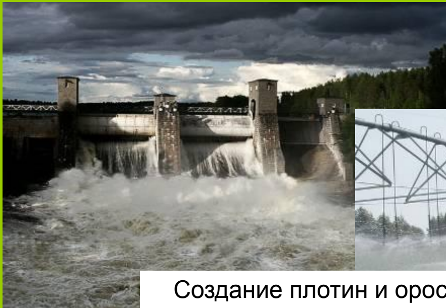
Создание плотин и оросительных систем