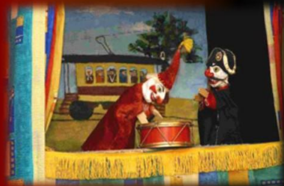
Основные сцены театрального представления