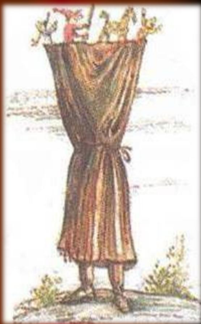
Ширмы русских петрушечников