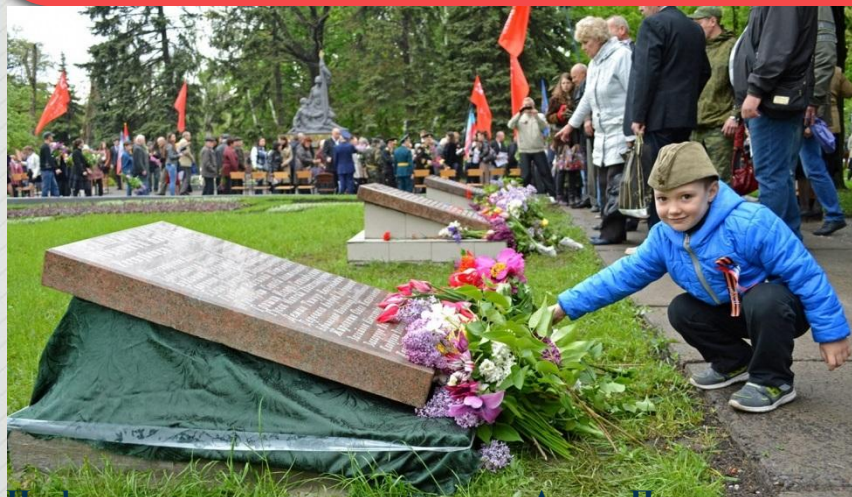
На фото: торжественное открытие «Аллеи Памяти» в 2016 году, а также учащиеся школы на различных мероприятиях у памятника освободителям Рутченково.

Но и на этом преобразование мемориала не закончилось. В 2016 году территория рядом с памятником стала Аллеей Памяти, где были установлены мемориальные плиты в память о Героях Советского Союза, воинах погибших в Афганистане и павших защитниках Донецкой Народной Республики. Мемориал освободителям Рутченково, является местом, где традиционно проходят различные мероприятия. Жители района, ветераны, ученики и учителя нашей школы каждый год приходят к мемориалу, чтобы почтить память наших героев.