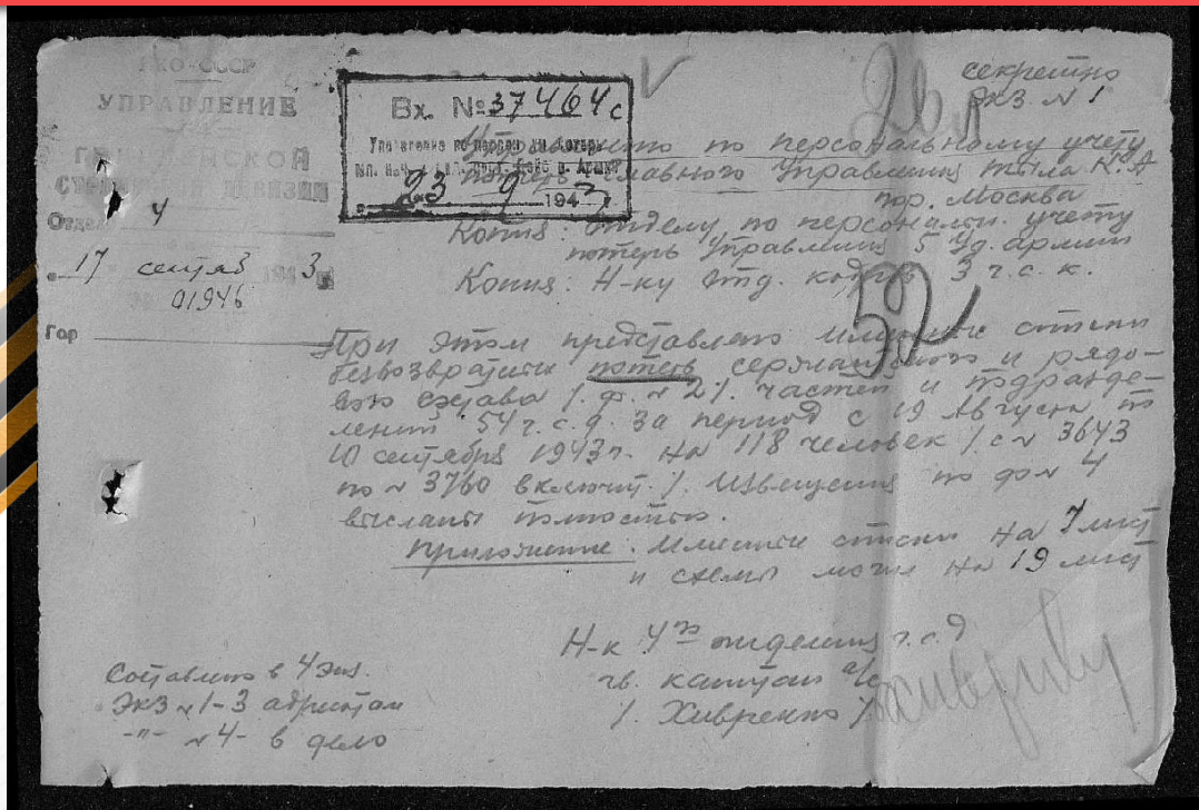
Архивные документы фиксирующие погибших солдат во время освобождения пос. Рутченково и города Сталино.