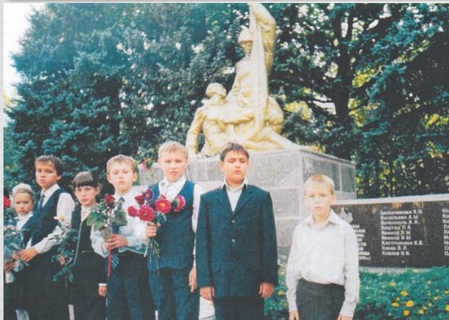
На фото: учащиеся школы № 93 на открытии новых блоков памяти в 2006 году.

В 2006 году мемориал снова был обновлён и блоки памяти стали гранитными. Теперь они хранят имена не только героев похороненных здесь, но и подпольщиков Кировского района. Всего на блоках высечено 36 имён воинов освободителей и 27 имён партизан-подпольщиков.