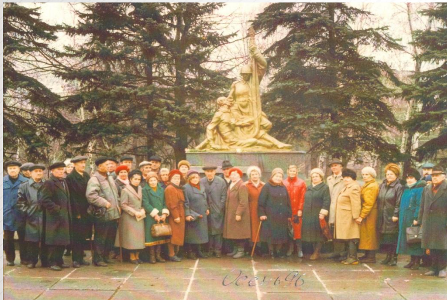
На фото: Открытие блоков памяти осенью 1996 года.