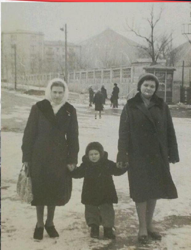
На фото: послевоенная Рутченковка в 1950-е годы. Парк у Дворца культуры имени И.Я. Франко и люди перед входом в здание ДК.

Наш Кировский район сегодня самый большой в городе. Стал он таким за счёт включения различных посёлков и территорий в черту города в 1937 году. Сам посёлок Рутченково был окончательно присоединён к городу Сталино уже в послевоенное время, поэтому мемориал посвящен именно освободителям Рутченково.