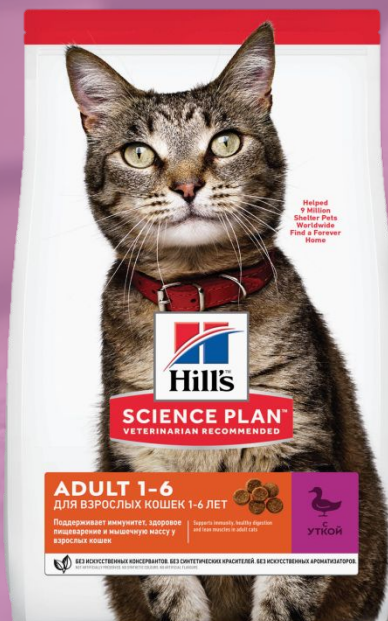
Hill's Science Plan Adult для взрослых кошек с уткой