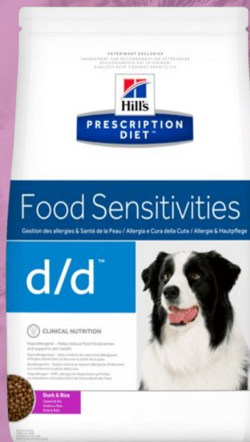
Hill's Prescription Diet d/d для собак (утка и рис – сухой вариант утка и картофель - консервы)