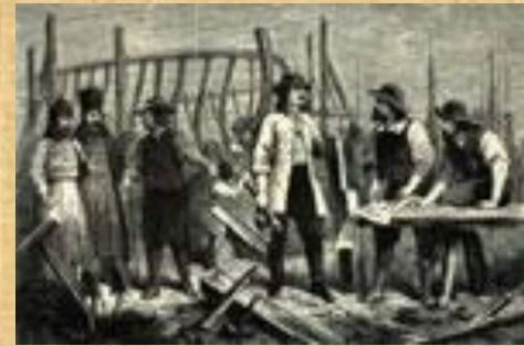
Петр на верфи

ОТВЕТ: ВСЕГО ПЁТР I ОСВОИЛ ОКОЛО 15 ПРОФЕССИЙ, В ТОМ ЧИСЛЕ ПЛОТНИКА, СТОЛЯРА, СЛЕСАРЯ, КУЗНЕЦА, ФЕЛЬДШЕРА, ПЕРЕВОДЧИКА, БУХГАЛТЕРА, КАРТОГРАФА, ШТУРМАНА, АРТИЛЛЕРИСТА, КОРАБЛЕСТРОИТЕЛЯ.