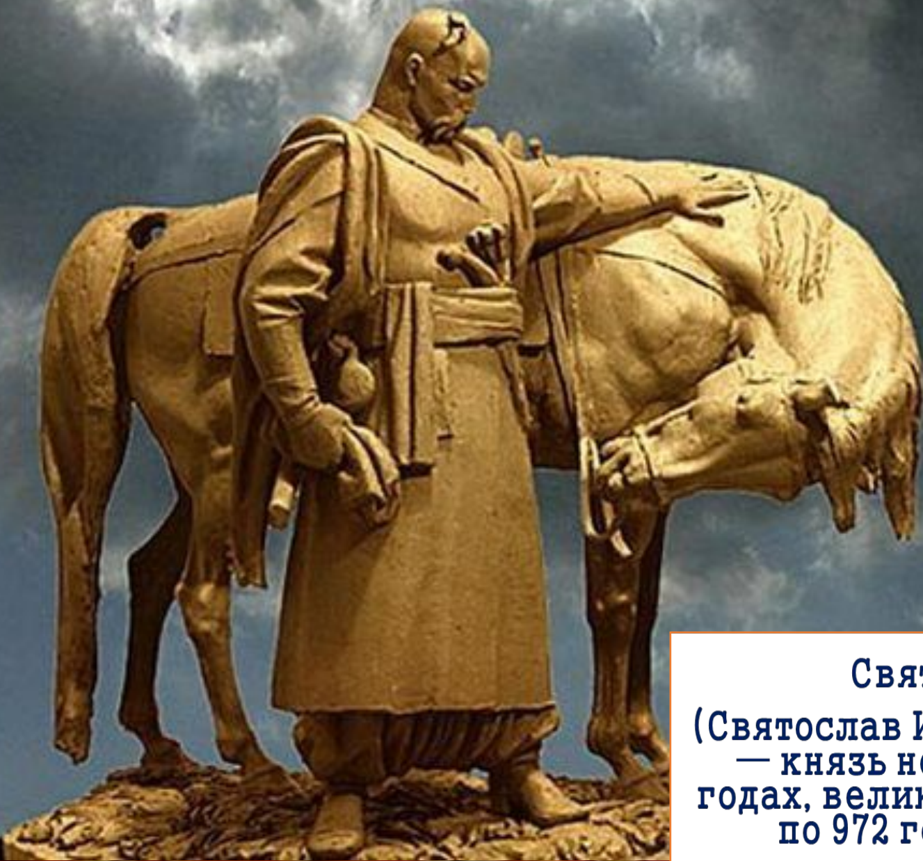
Святослав Игоревич (Святослав Игоревич, 942 — март 972) — князь новгородский в 945—969 годах, великий князь киевский с 945 по 972 год, прославился как полководец.