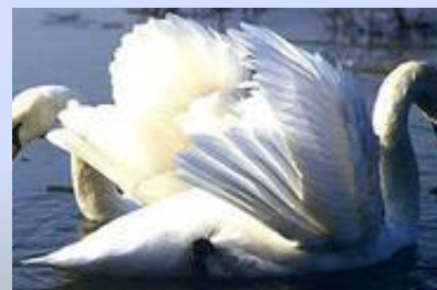
крылья и хвост лебедея