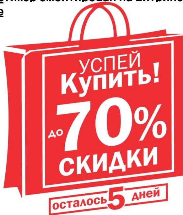
Как выглядит сам стикер стикера

Когда стикер смонтирован на витрине, согласно визуализации , вытрите лишнюю воду со стекла и стике